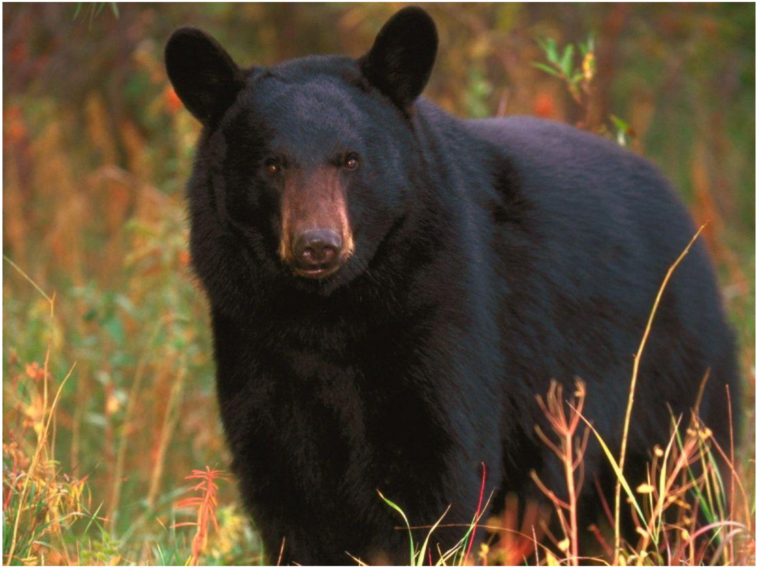
чёрный медведь (барибал)