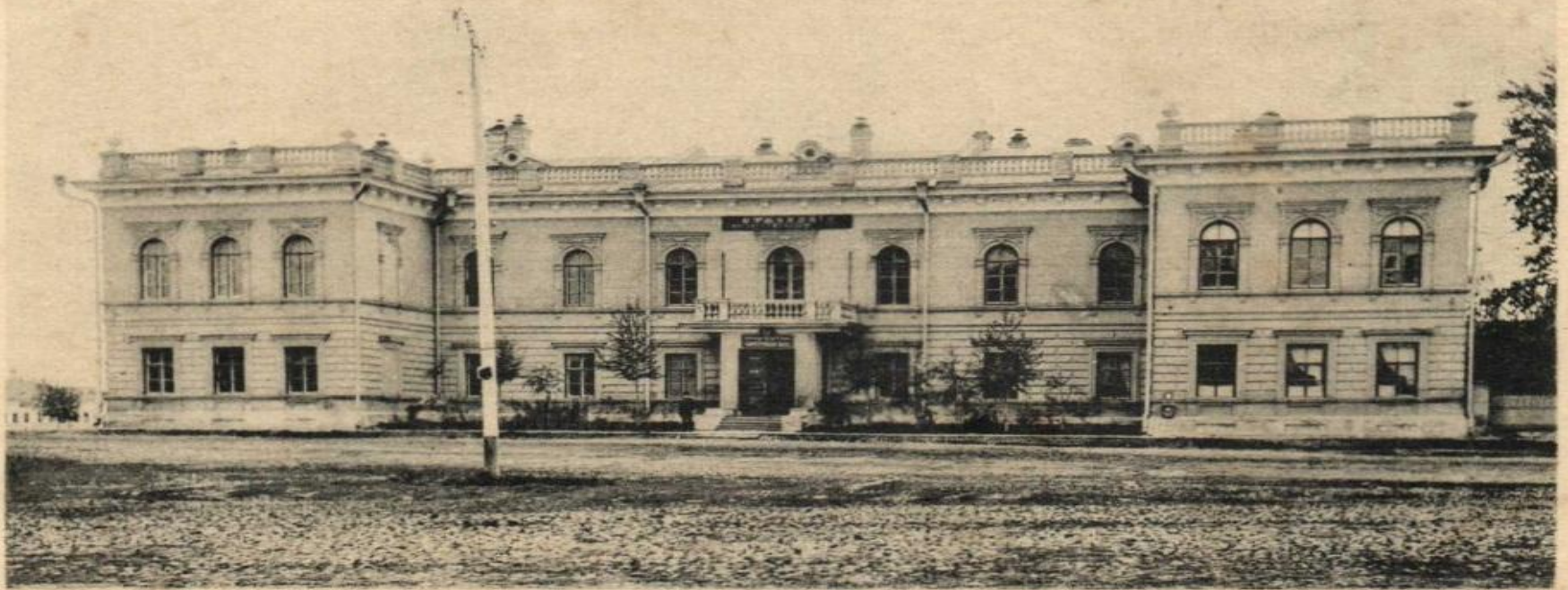
Вологда. Отд. Государственного Банка.