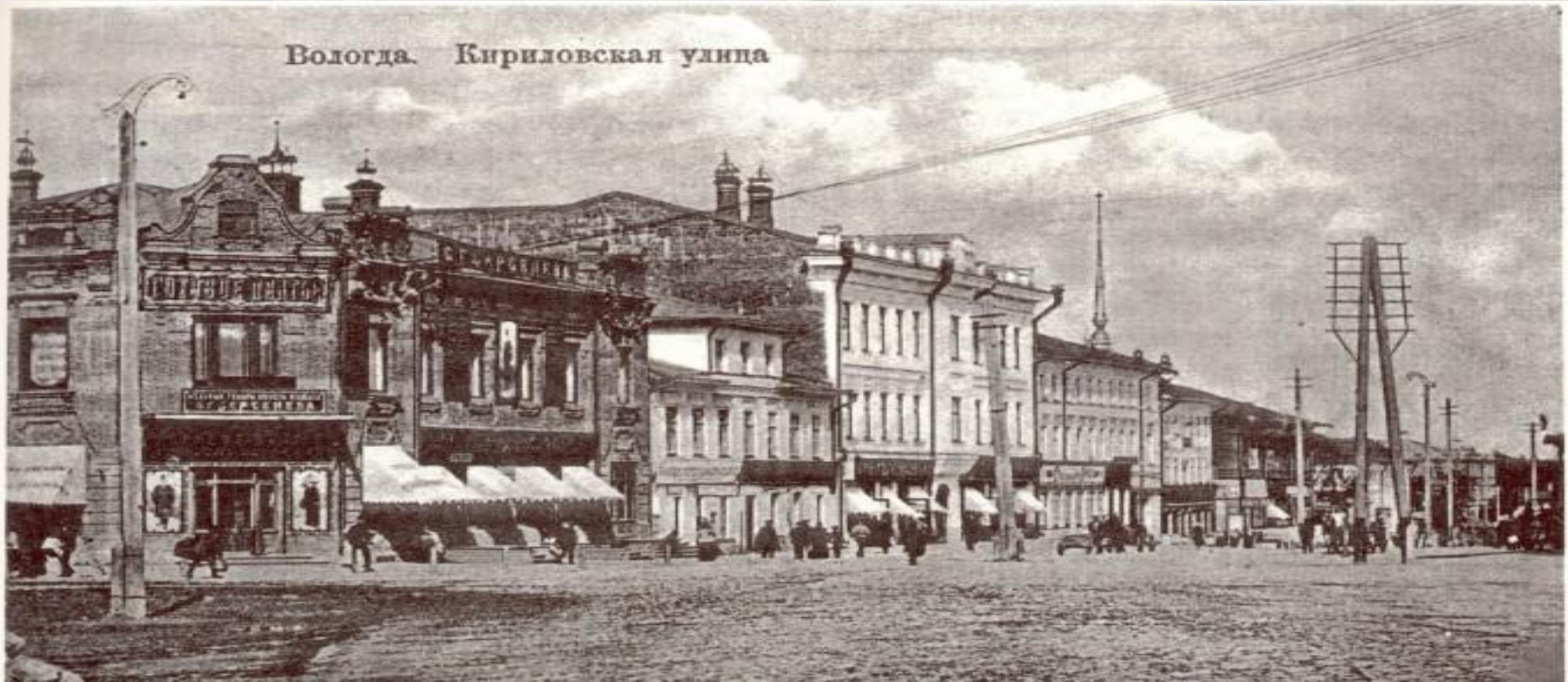
Вологда. Кирилловская улица

Открытие Вологодского отделения Государственного банка состоялось в 1865 году в арендованном помещении на Кирилловской улице (в настоящее время улица Ленина). Первым управляющим отделением был назначен Петр Потапович Шелехов.