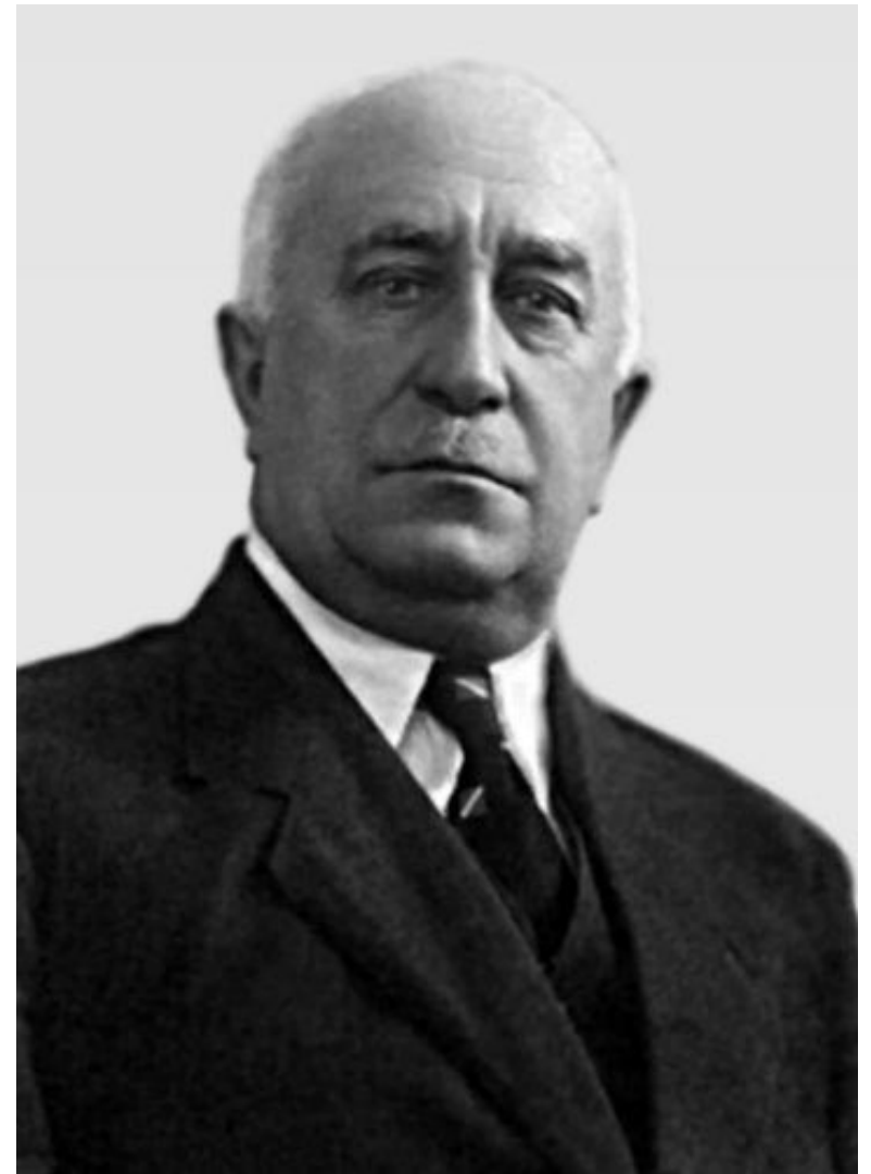
Владимир Николаевич Сукачёв 26.(07.06).1880 – 09.02.1967

Биогеоценоз (от греч. βίος — жизнь γη — земля + κοινός — общий) — система, включающая сообщество живых организмов и тесно связанную с ним совокупность абиотических факторов среды в пределах одной территории, связанные между собой круговоротом веществ и потоком энергии.