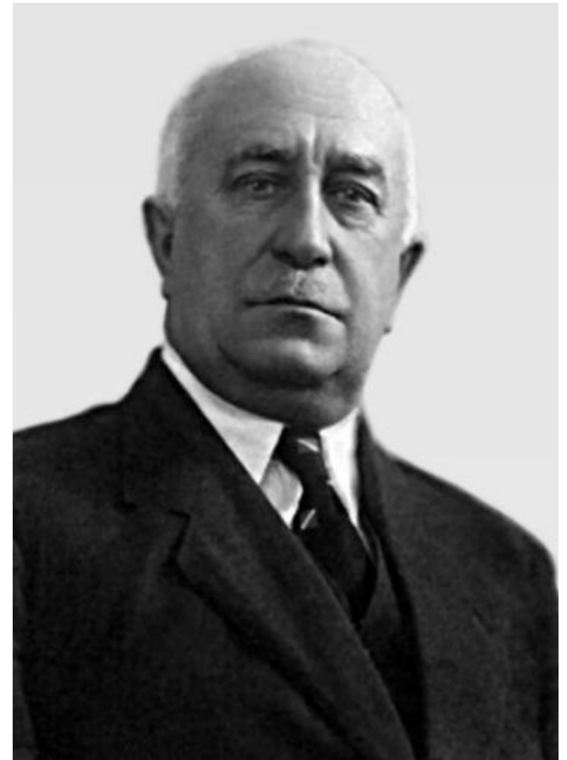
Владимир Николаевич Сукачёв 26.(07.06).1880 – 09.02.1967

Биогеоценоз (от греч. βίος — жизнь γη — земля + κοινός — общий) — система, включающая сообщество живых организмов и тесно связанную с ним совокупность абиотических факторов среды в пределах одной территории, связанные между собой круговоротом веществ и потоком энергии.