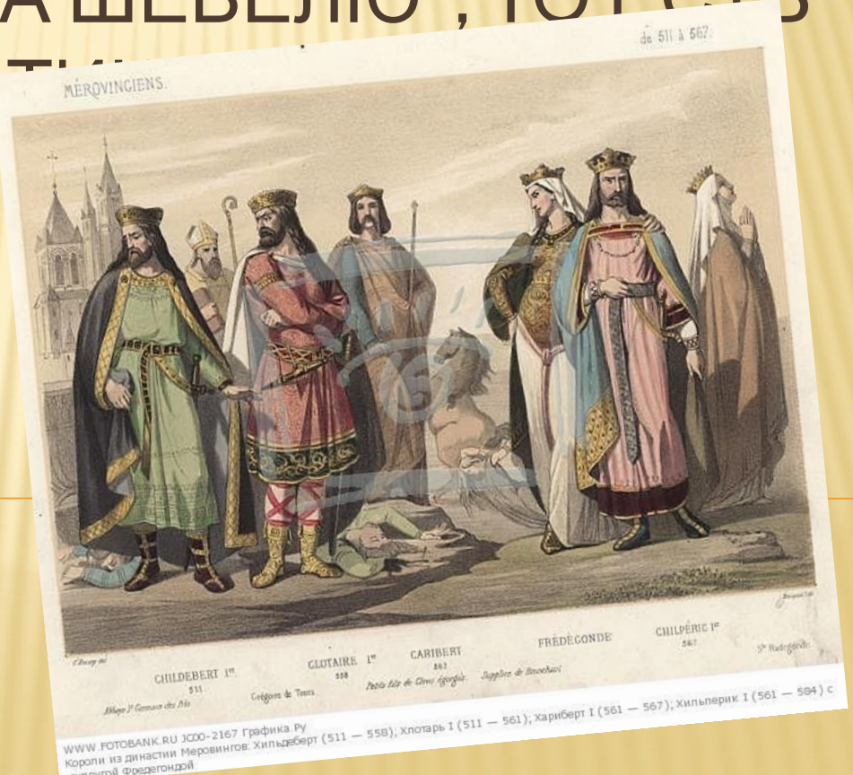
Короли из династии Меровингов: Хильдеберт (511 — 558), Хлотарь I (511 — 561), Хариберт I (561 — 567), Хильперик I (561 — 594) с супругой Фредегондой