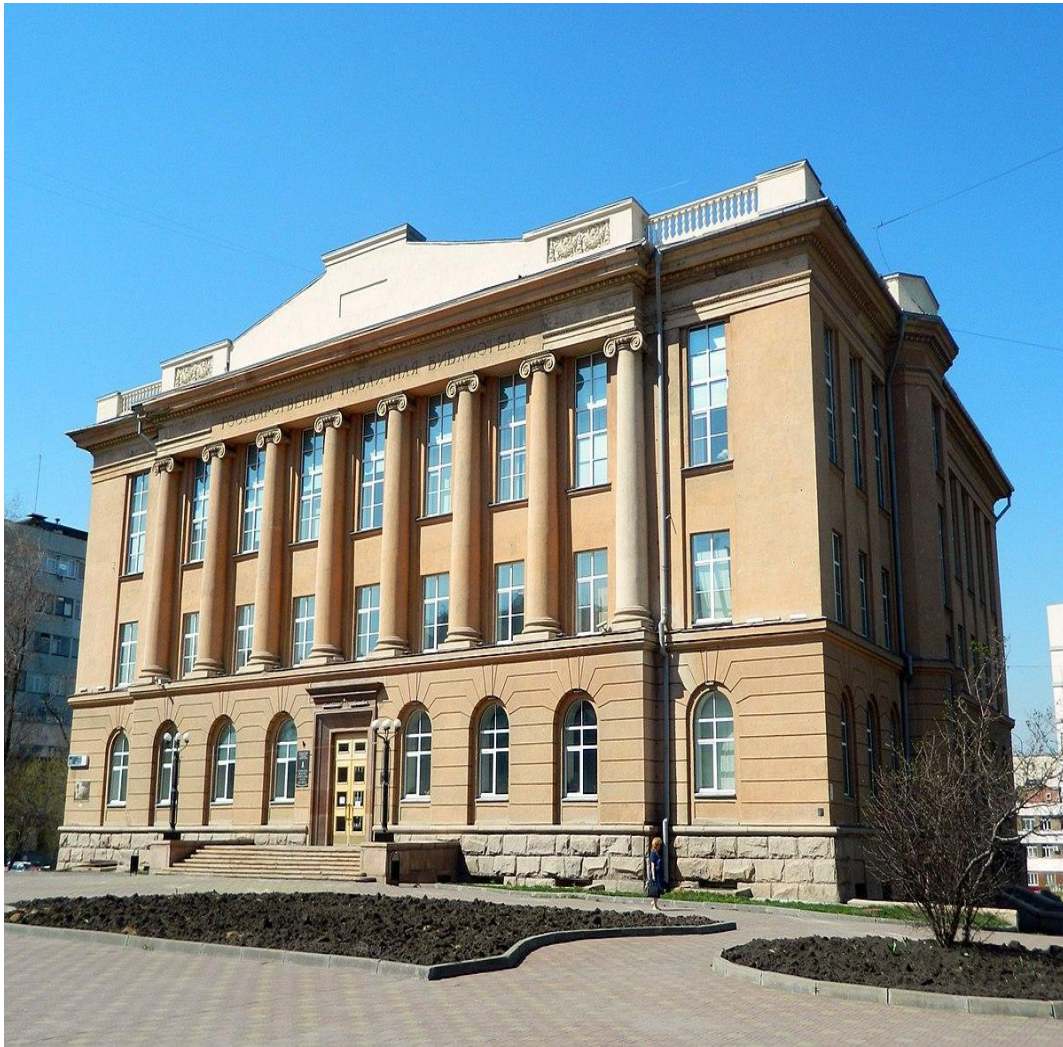
Публичная библиотека, место проведения Литературных мастерских