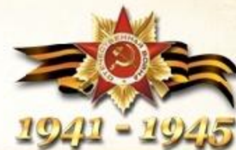
БОУ «Кутырлинская СШ»