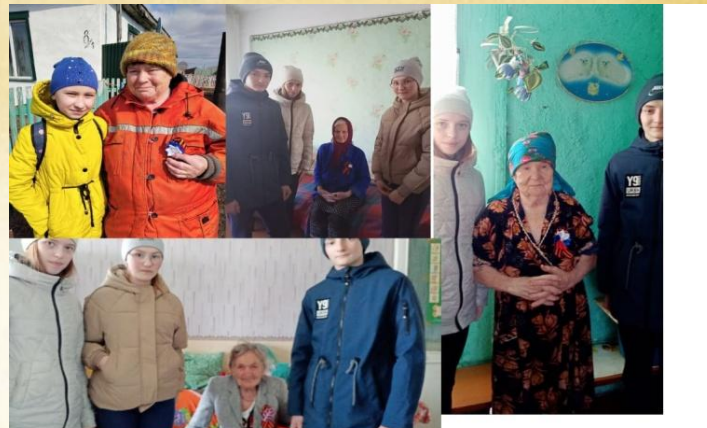
Поздравление тружеников тыла