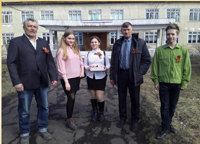
БОУ «Чапаевская СШ» Акция «Георгиевская ленточка»

Во многих образовательных учреждениях были организованы акции