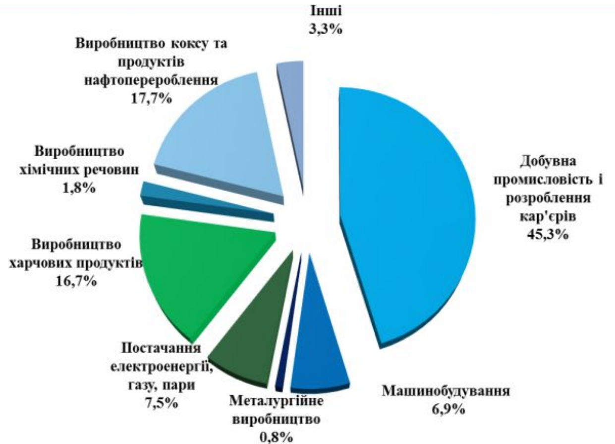
Мал. Структура обсягів реалізованої промислової продукції у 2018 році, %

Полтавська область відноситься до числа лідерів з розвинутою промисловою базою. Виробнича спеціалізація області: видобуток вуглеводнів, розроблення кар'єрів, виробництво коксу та продуктів нафтопереробки, харчових продуктів і напоїв, хімічної продукції, машинобудування. За обсягами реалізованої промислової продукції область займає 5 – 6 місце серед регіонів України та забезпечує понад 7% загальнодержавного обсягу.