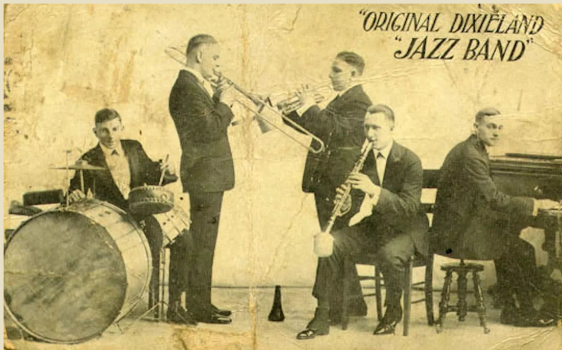
«Original Dixieland Jazz Band»