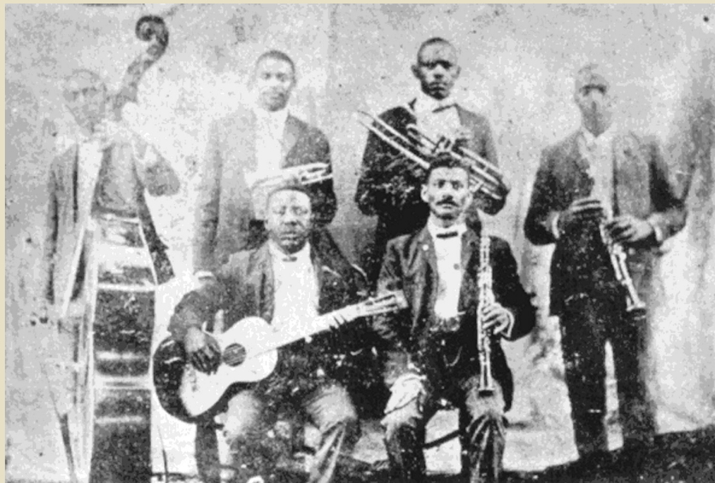
«The Bolden band»