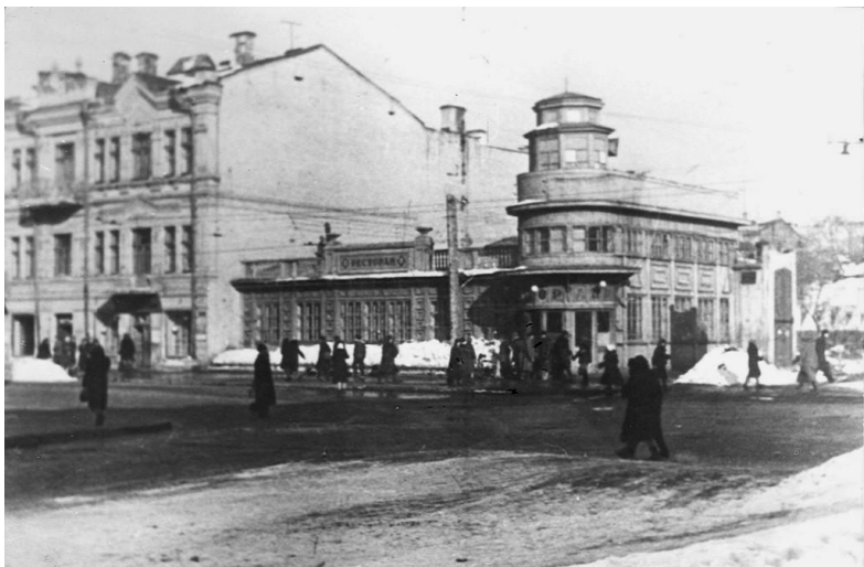
Ресторан «Арктика» 1930-е