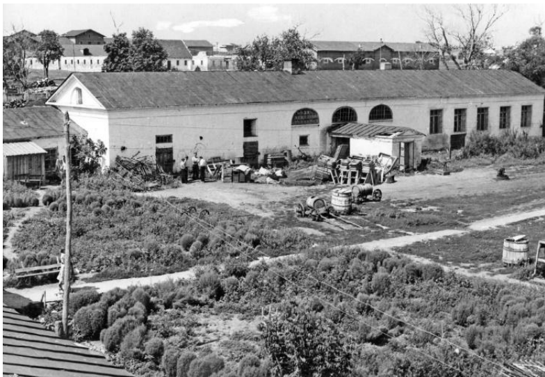
Усольская усадьба. Здание столярных мастерских сельскохозяйственного техникума. Фото 1975 года