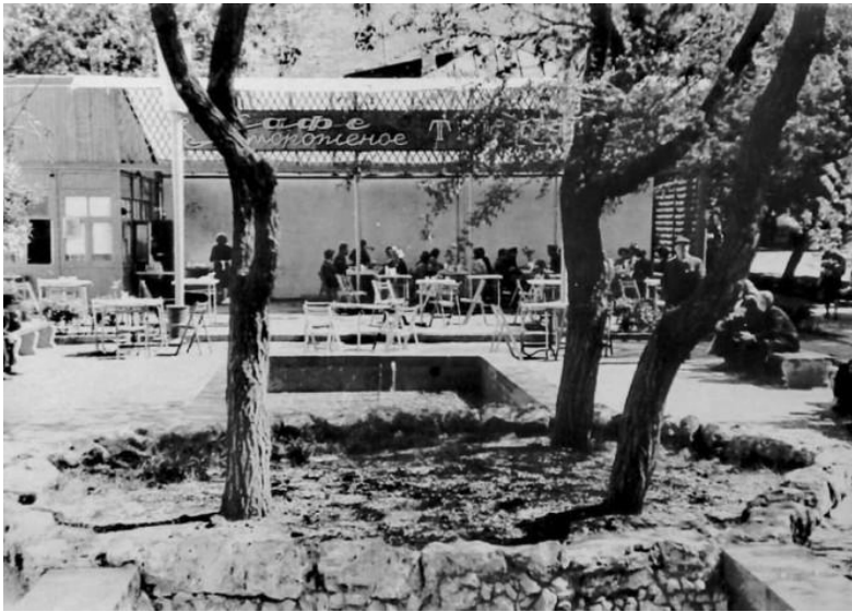
Сквер «Три Вяза» 1950-е