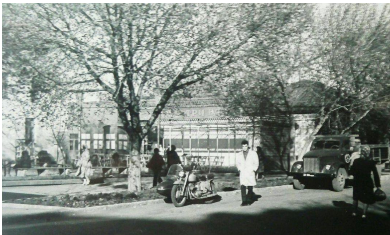
Кафе «Три вяза» 1950-е