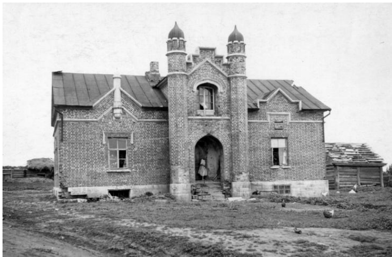
Усольская усадьба графа Орлова-Давыдова Здание XIX века для служащих Фото 1953 года