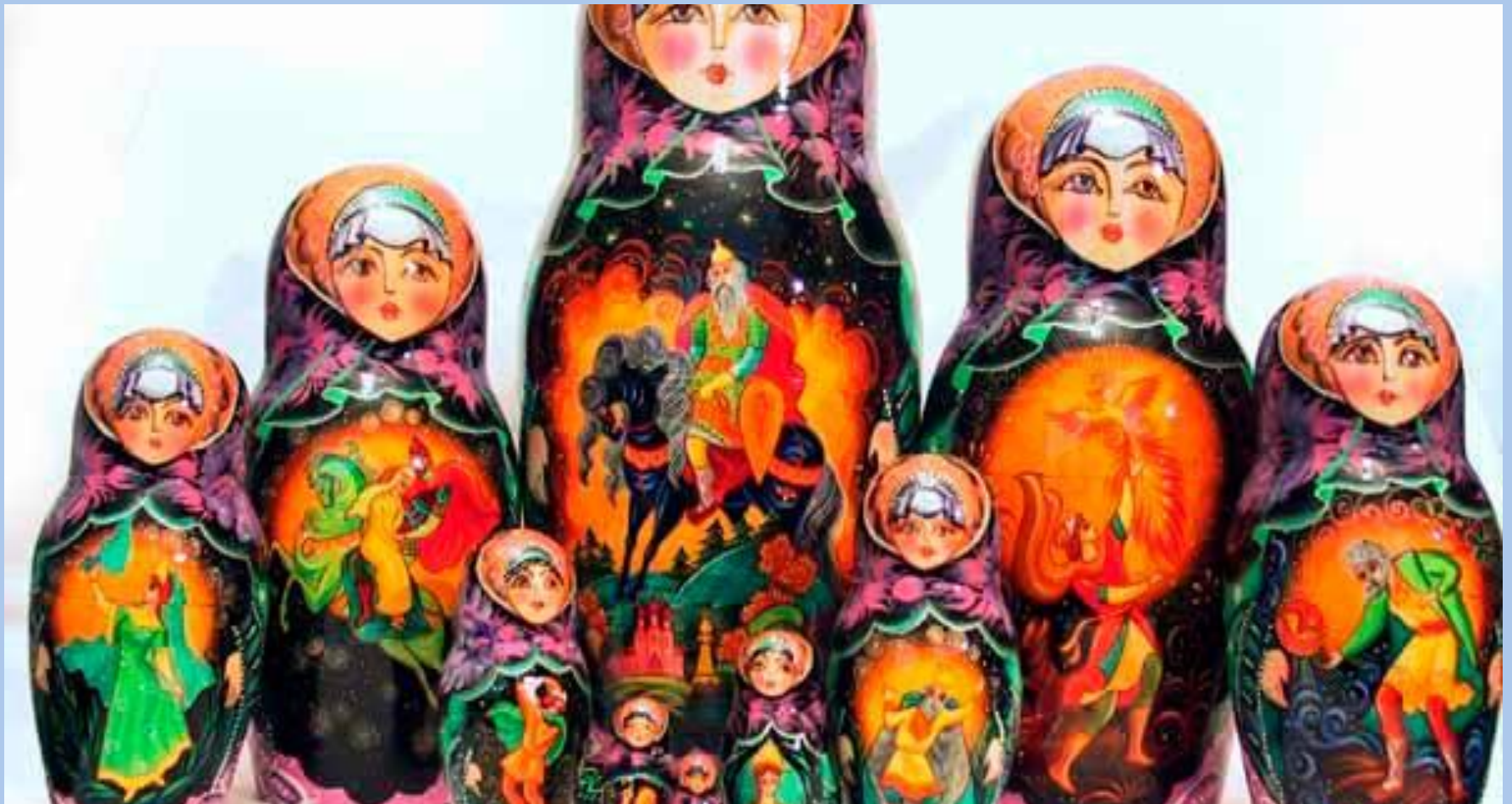
Матрешка по мотивам сказки "Руслан и Людмила", Сергиев Посад, 1998.

Изначально типажи матрешек были самые разные и изображали как мужские, так и женские персонажи. Постепенно женский персонаж стал доминирующим.