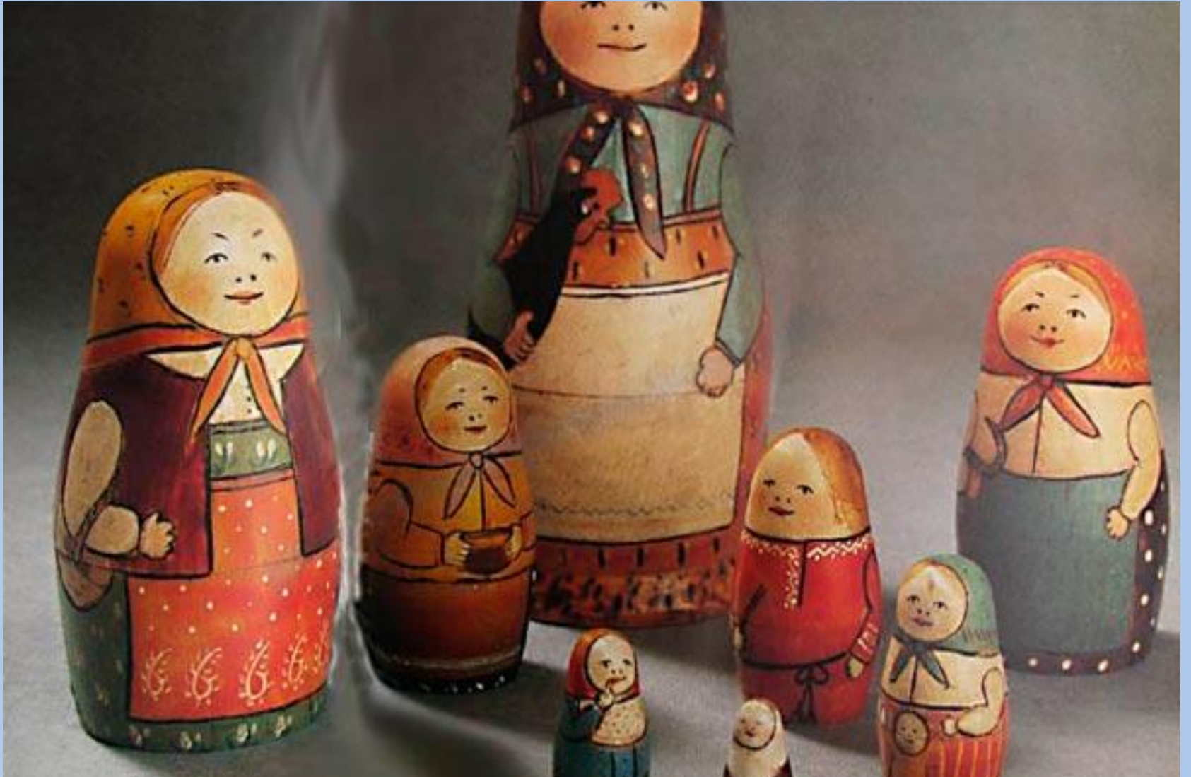
Первая русская матрешка Сергея Малютина