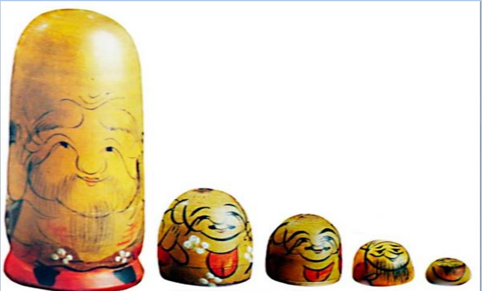
Семиместная матрешка "Фукурама", Япония, ок. 1890