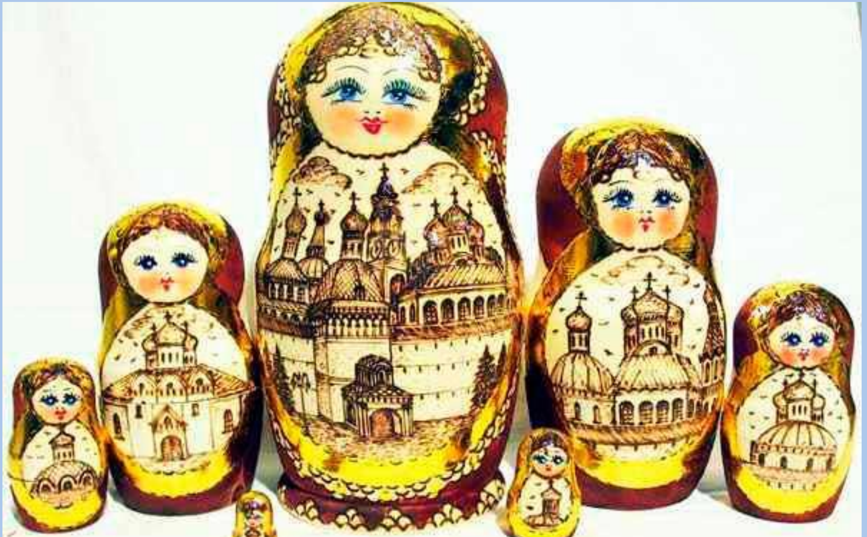
Сергиево Посадские матрешки: сверху вниз - 1990 и 1998 годы.