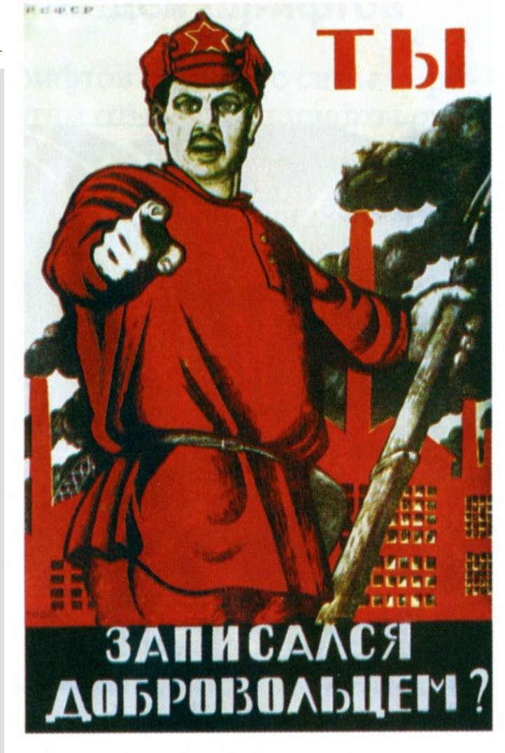
Плакат Д.С.Моора 1920 г.