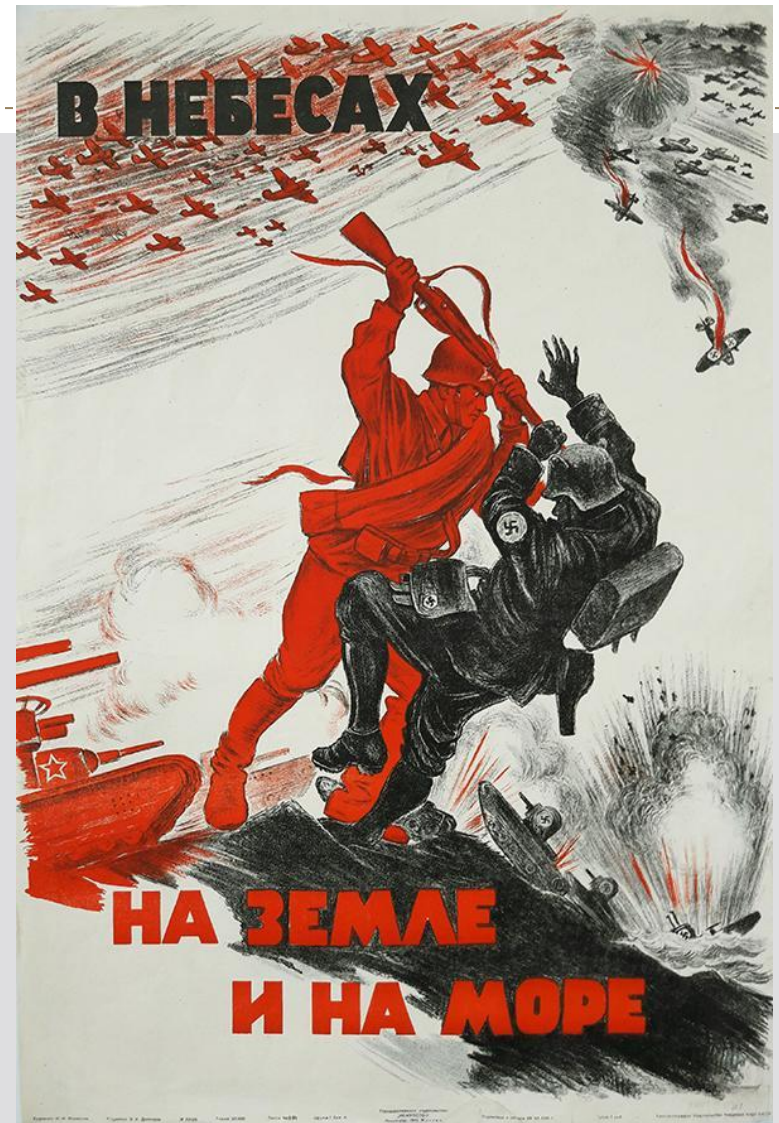
Плакат Н.М.Кочергина «В небесах на земле и на море», 1941 г.