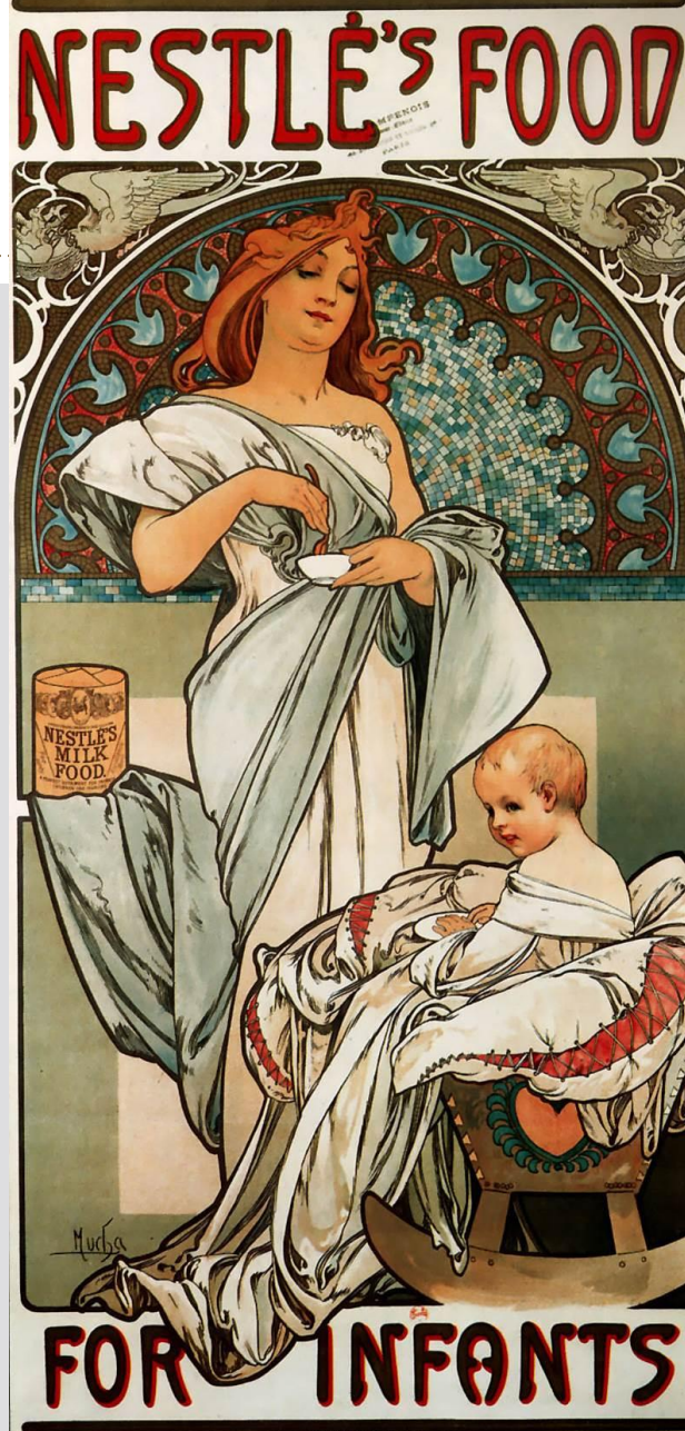
Плакат Альфонса Мухи