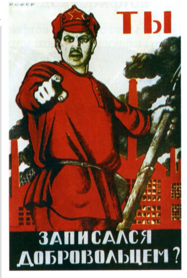
Плакат Д.С.Моора 1920 г.