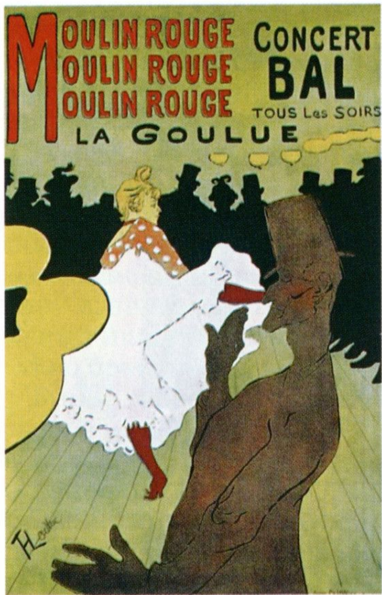
Плакат Анри де Тулуз-Лотрека 1889 г.