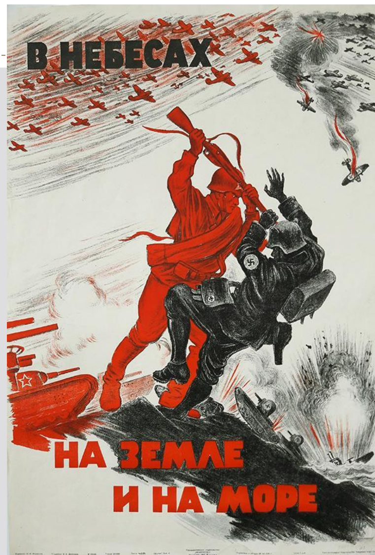
Плакат Н.М.Кочергина «В небесах на земле и на море», 1941 г.