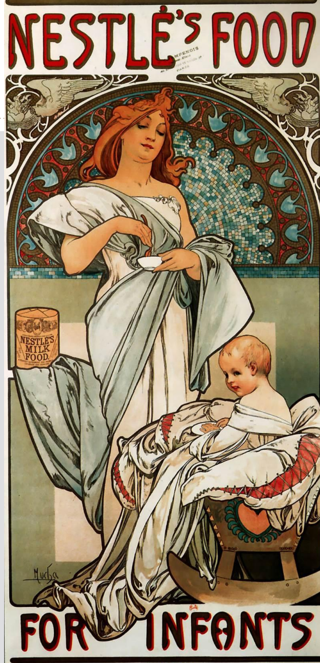
Плакат Альфонса Мухи