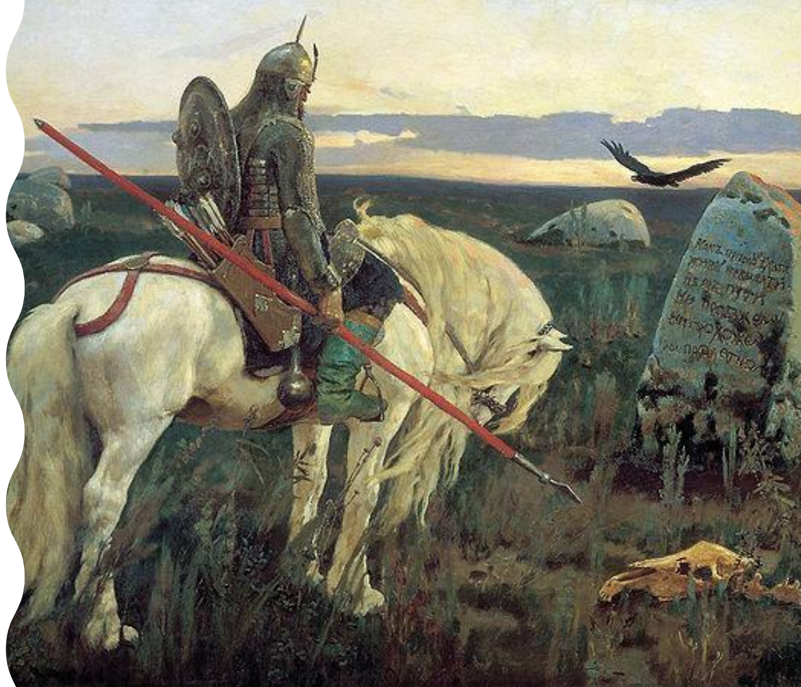
Васнецов В.М. Витязь на распутье. 1882 г. Холст. Масло. ГР