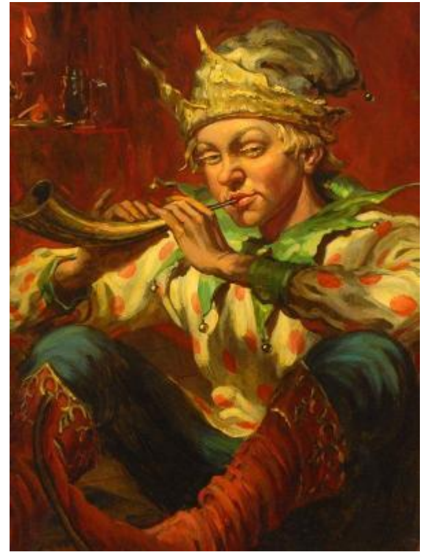
Скоморох в России 18 века

До Петра I был издан царский указ, который запрещал скоморохам участвовать в торжествах и повелевал уничтожать их маски и музыкальные инструменты. Поэтому, начиная с этого времени, музыканты, исполняющие народные песни, переходили на нелегальное положение и лишались всех привилегий.