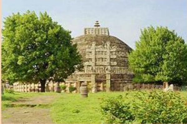
Большая ступа №1 , где хранятся реликвии Будды

Развитие древнеиндийской архитектуры имеет некоторые особенности. Памятники существовавшие до III века до н. э., не сохранились до наших дней, так как строительным материалом служило дерево. С III века до н. э. в строительстве используют камень.