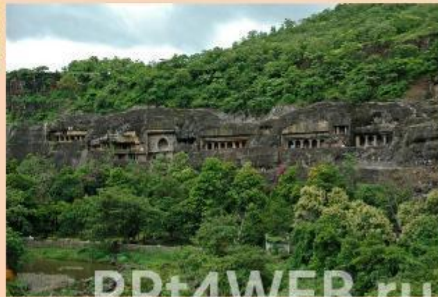
Пещерный храм в Аджанте (империя Гуптов )