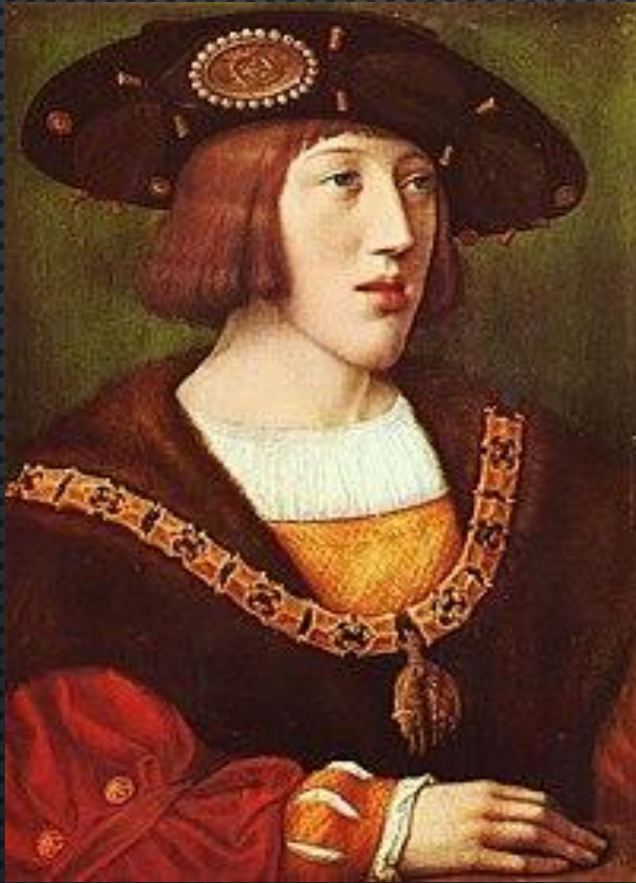
Карл V Габсбург