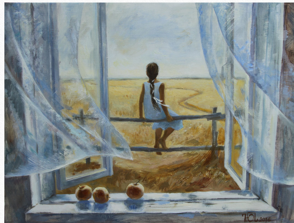
Картина: Юлия Андреевна Петрова - Ожидание