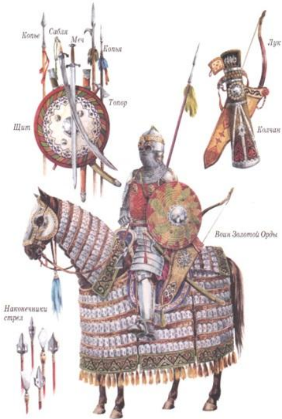
ВООРУЖЕНИЕ ВОИНОВ ЗОЛОТОЙ ОРДЫ. XIV ВЕК