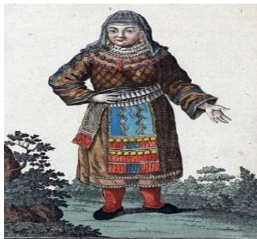
Чухонецкая крестьянская баба Ein Finnisches Bauern-Weib Faisanne de Finlande.