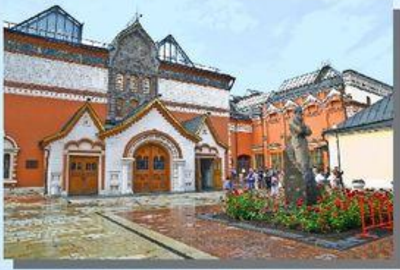
в Третьяковской галерее