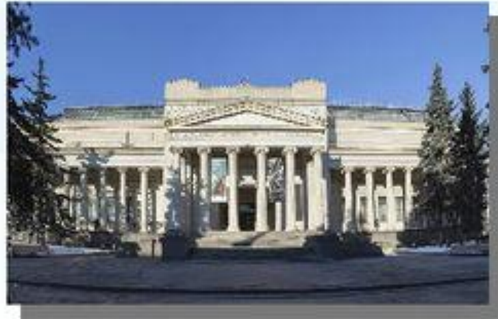
в музее изобразительных искусств имени А.С. Пушкина