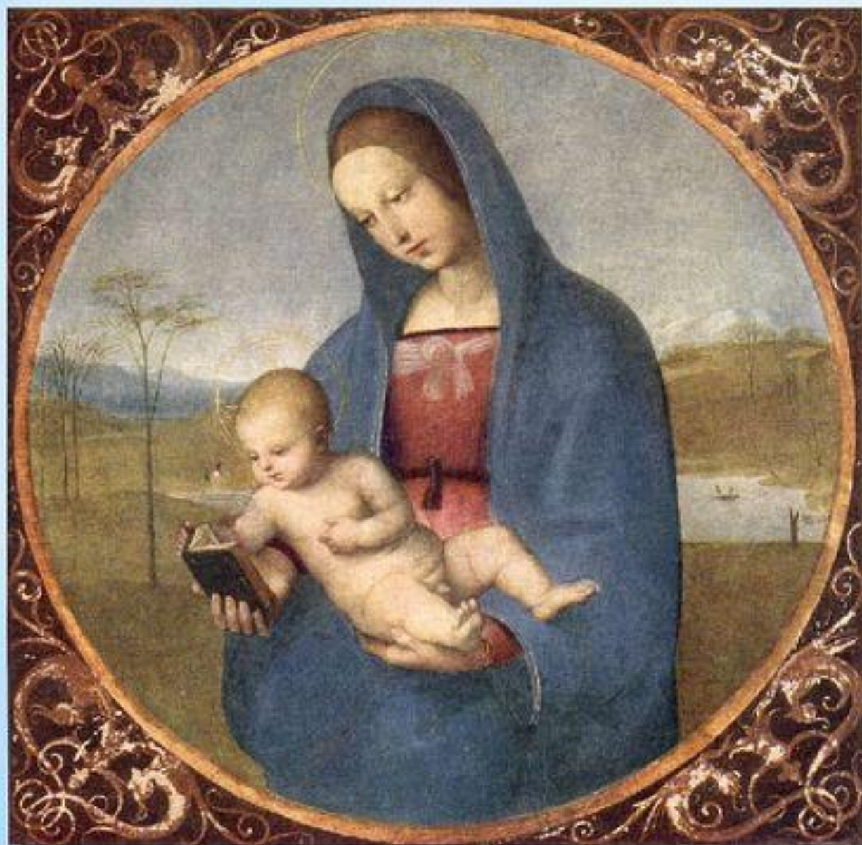
«Мадонна Конестабиле» Рафаэль