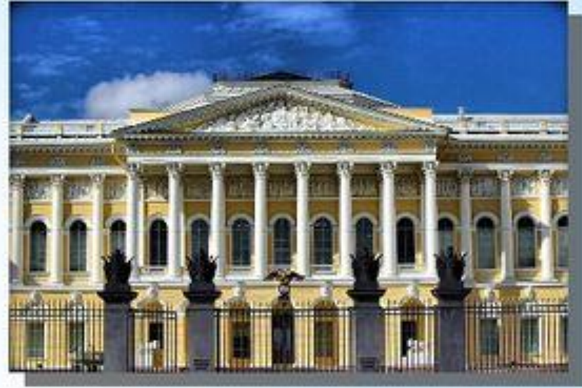
в Русском музее