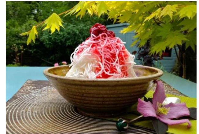
Иранская сладость – фалуде