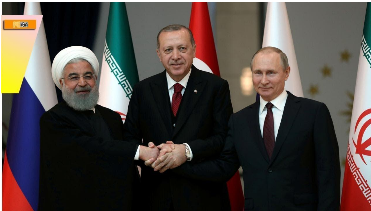
Х. Роухани, В. Путин, Р. Т. Эрдоган

Была достигнута договоренность о проведении в конце января 2018 в Сочи Конгресса сирийского национального диалога, на который будут приглашены как сторонники президента Б. Асада, так и представители оппозиции.