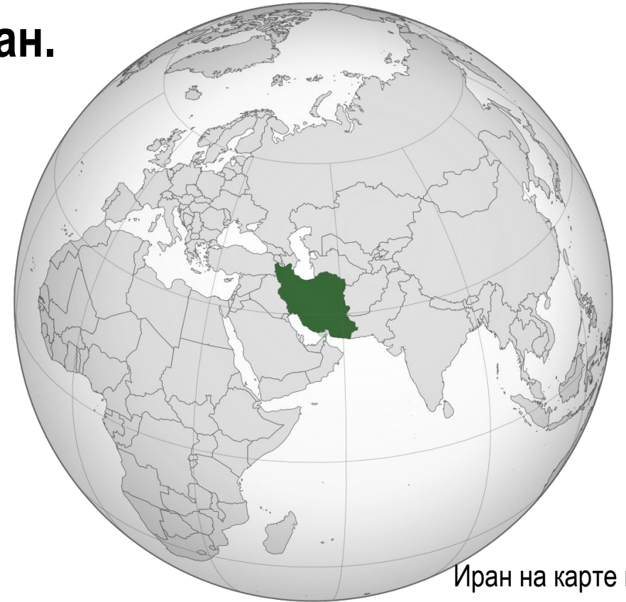
Иран на карте мира

Иран - теократическая республика, имеющая элементы религиозной и республиканской власти.