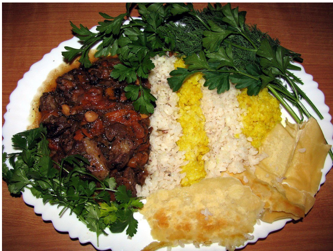
Плов в иранском варианте