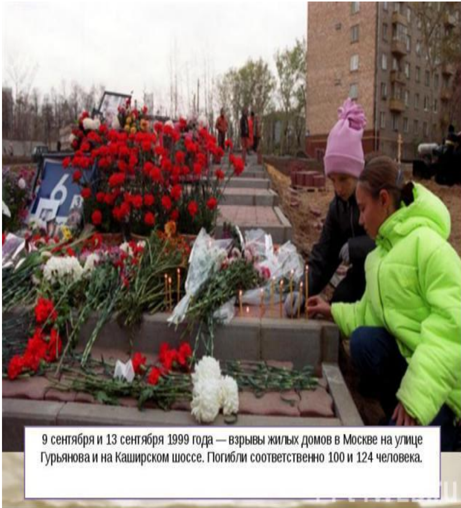
9 сентября и 13 сентября 1999 года — взрывы жилых домов в Москве на улице Гурьянова и на Каширском шоссе. Погибли соответственно 100 и 124 человека.