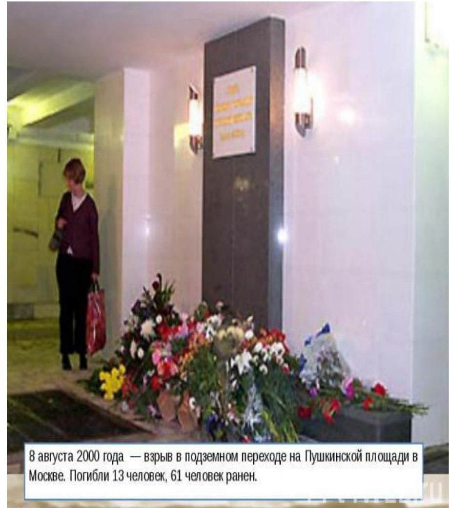
8 августа 2000 года — взрыв в подземном переходе на Пушкинской площади в Москве. Погибли 13 человек, 61 человек ранен.