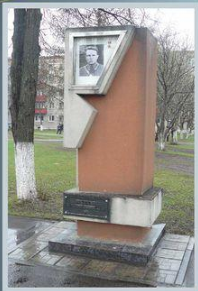
Аллея героев город Ковров