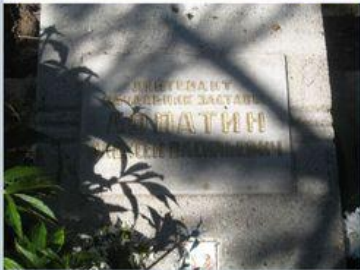
Памятник на 13-ой заставе.