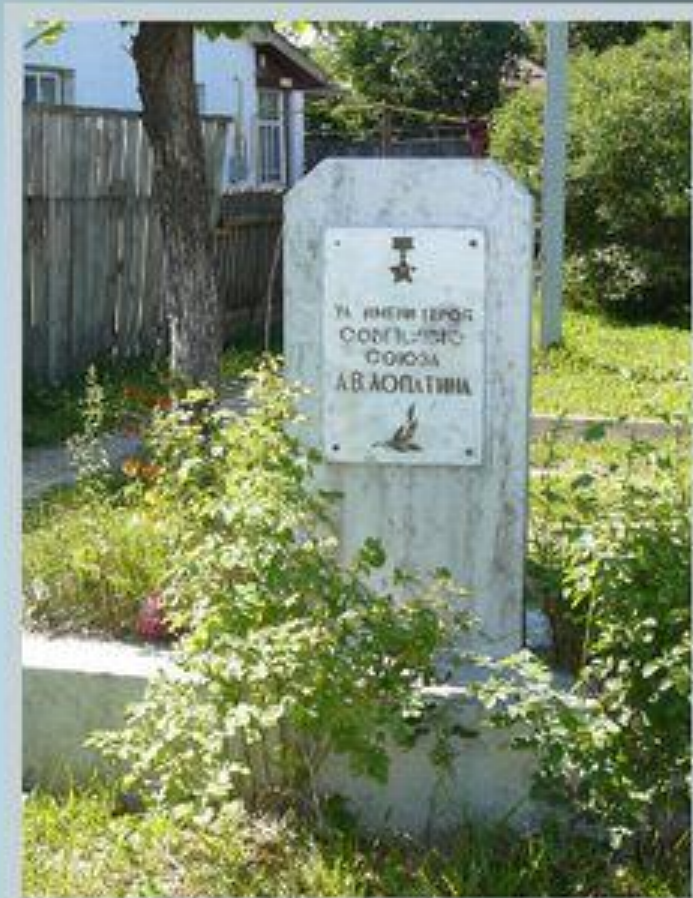
Улица имени А.В.Лопатина в посёлке Савино Ивановской области