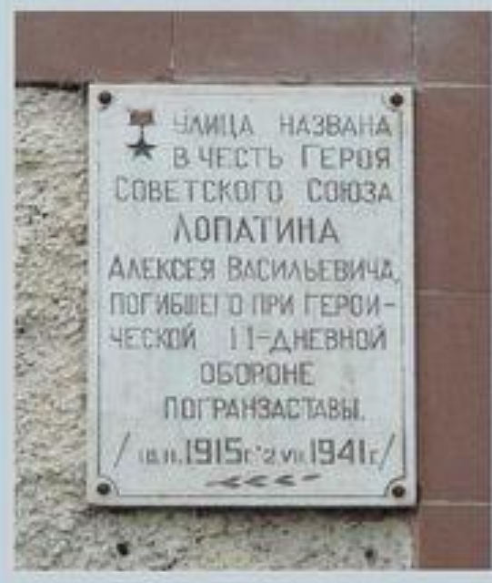
Улица имени А.В.Лопатина в Коврове