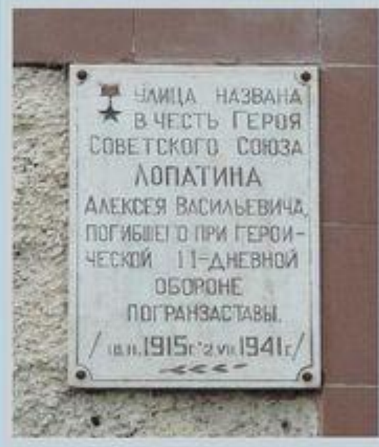
Улица имени А.В.Лопатина в Коврове