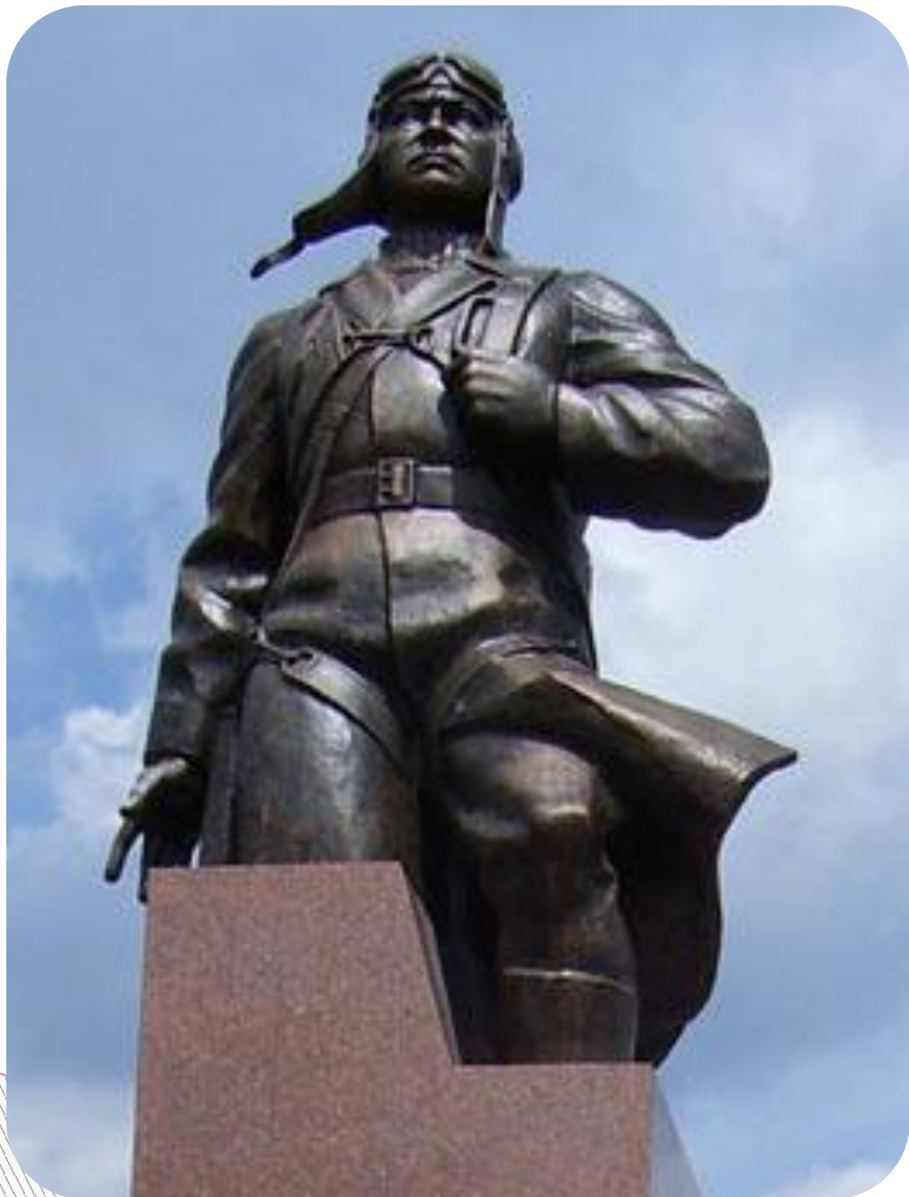
Памятник А. Маресьеву в городе Камышине