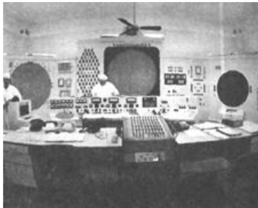
Самостоятельное управление по эксплуатации реактора АВ-2