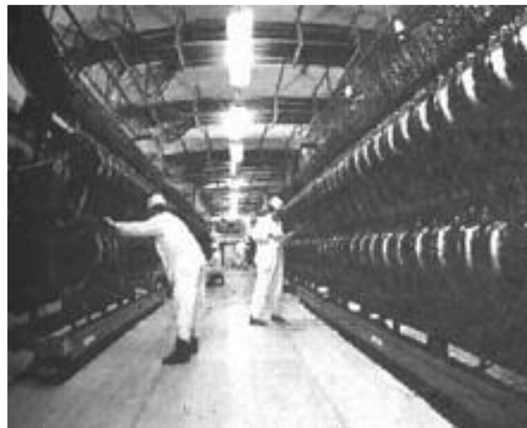
Монтаж и пуск реактора