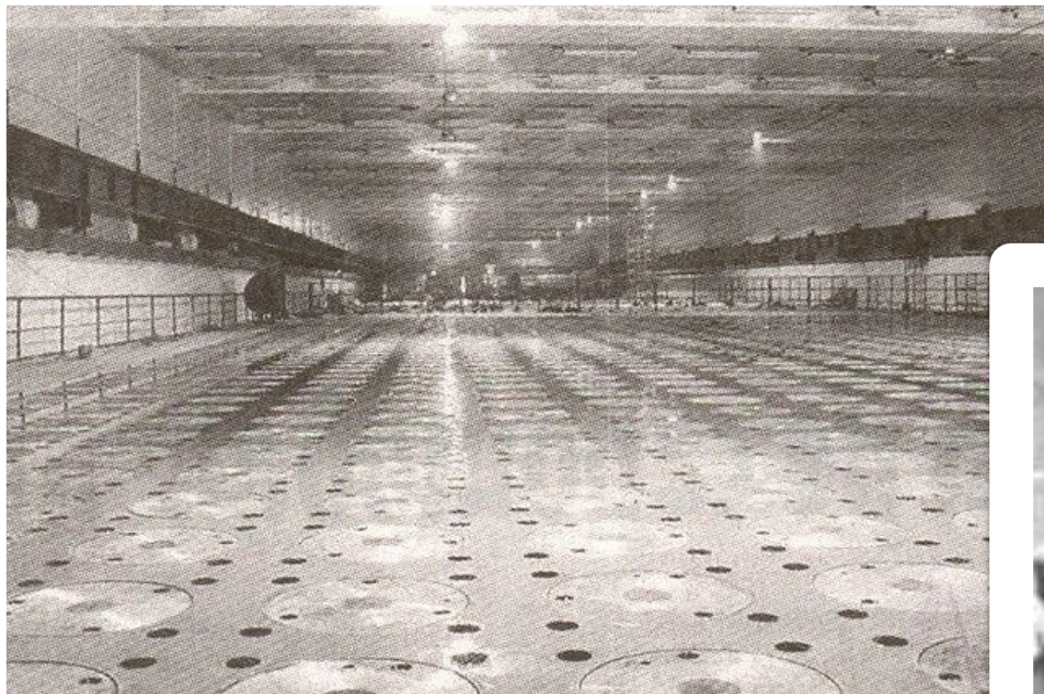
Хранилище делящихся материалов