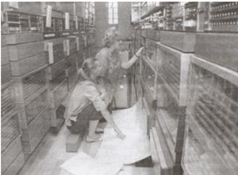
Цех связи ФГУП ПО «Маяк» г. Озерска 1948 года