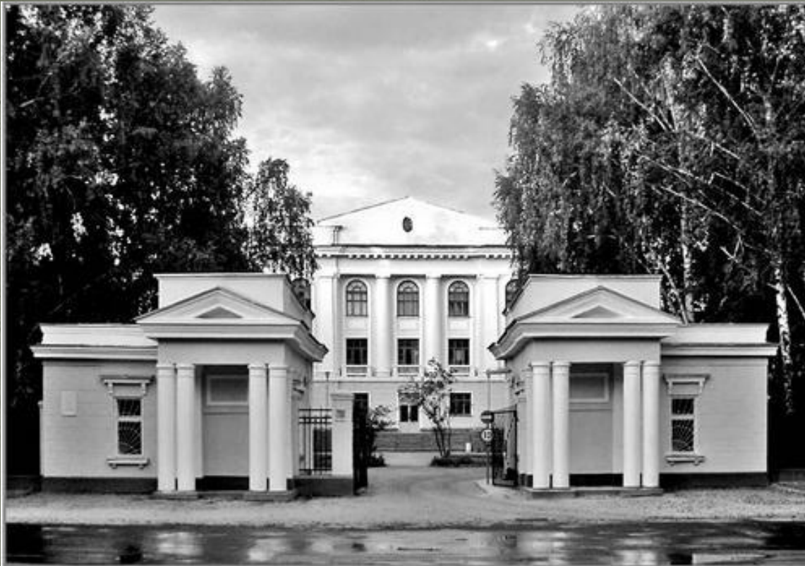
Центральная заводская лаборатория