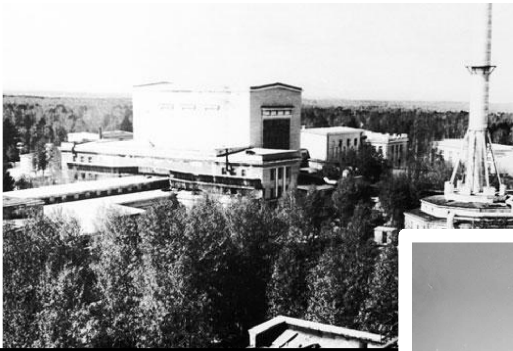
Реактор "А" на предприятии "Маяк" для сырья для производства ЯО.