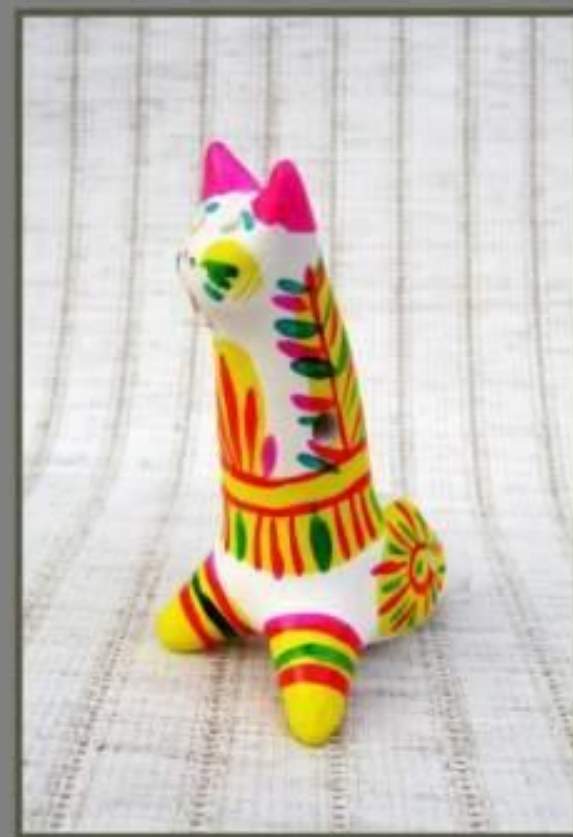
свисток 7 см.