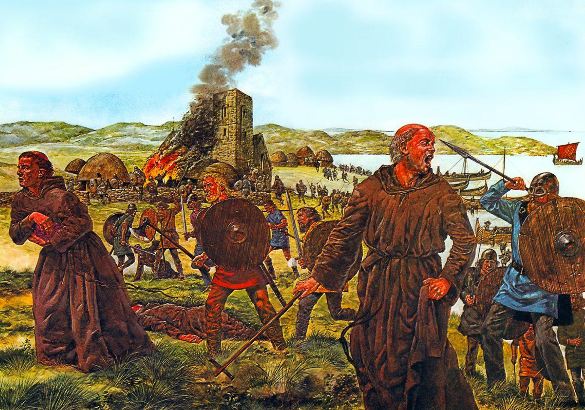
Нападение викингов на монастырь Линдисфарн. Рисунок