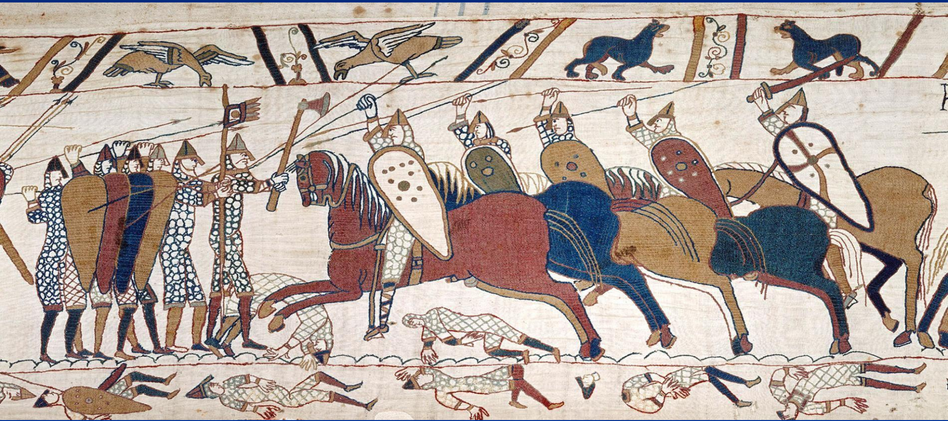
Битва при Гастингсе. Средневековая вышивка

1066 – последний крупный поход норманнов, битвы при Стемфорд-Бридж и Гастингсе