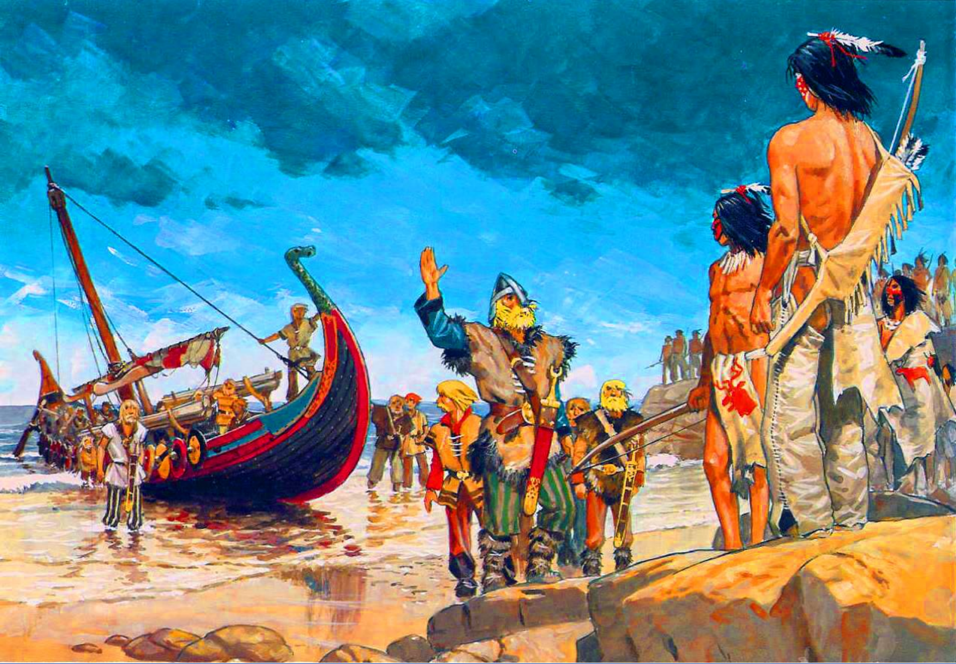
Высадка Лейва Счастливого в Америке. Рисунок