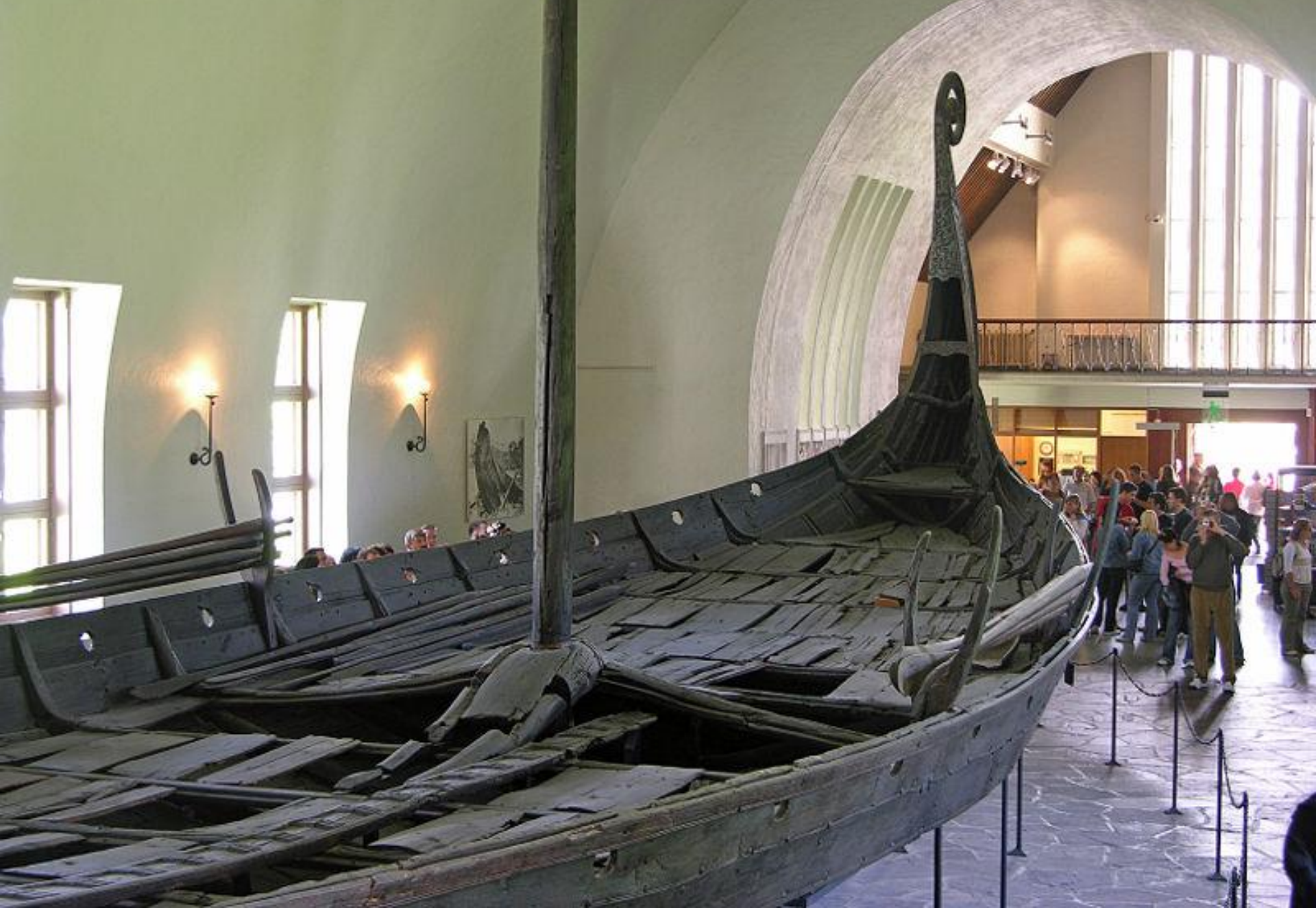
Драккар в музее флота в Осло. Норвегия. Фото