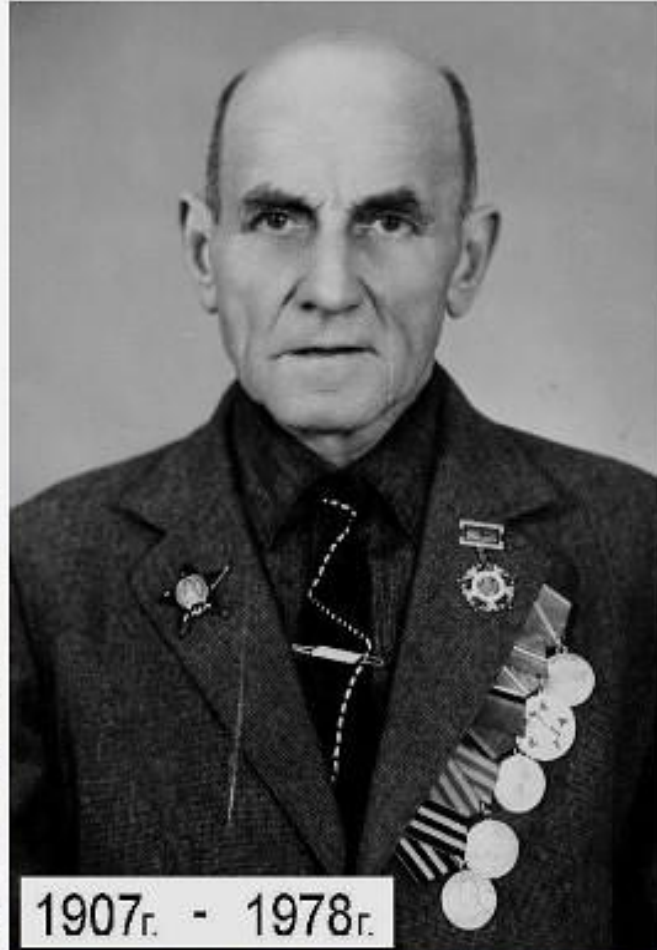
1907г. - 1978г.