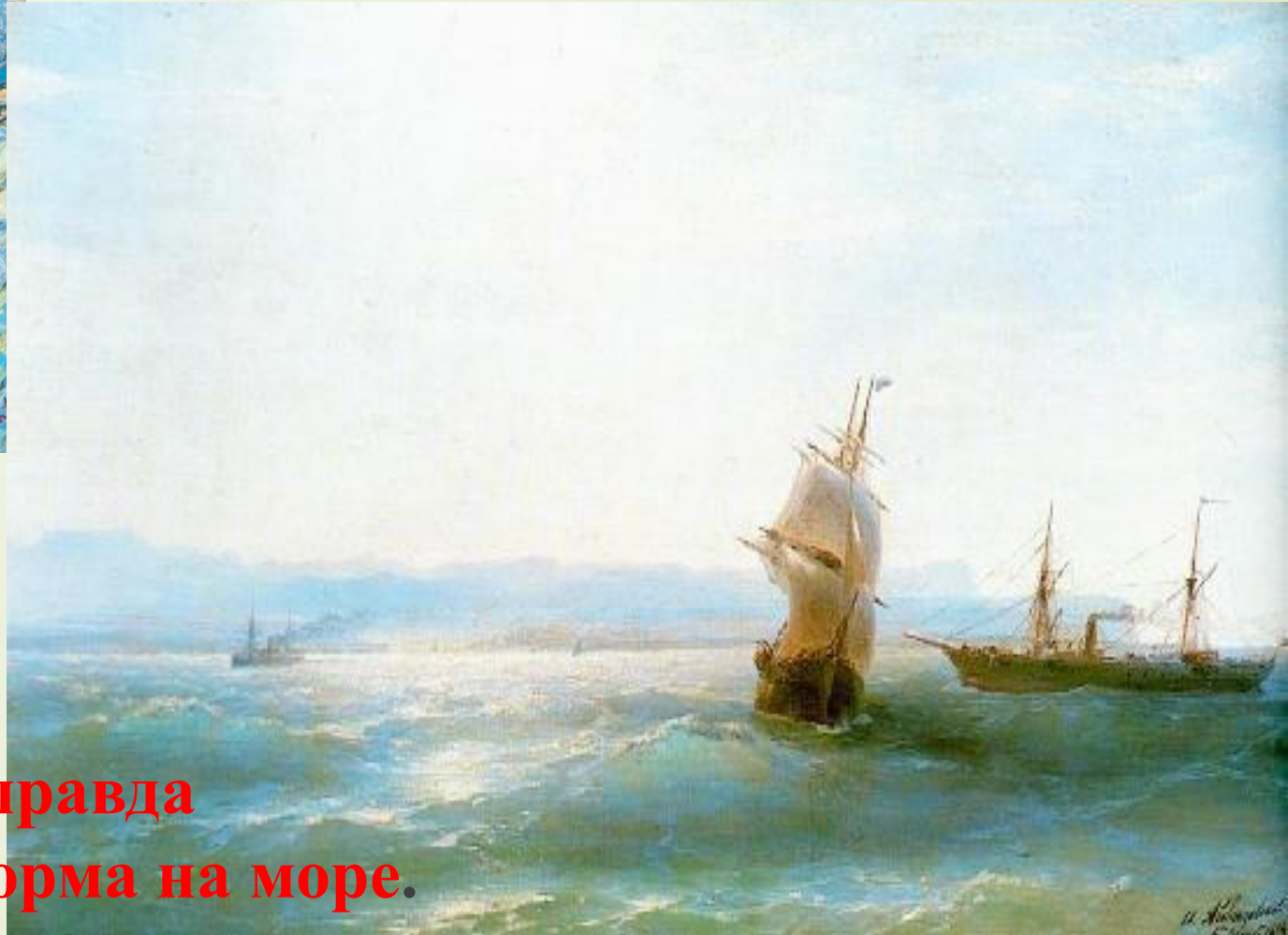
Иван Айвазовский «Солнечный день»

У каждого из них своя правда в передаче картины моря, шторма на море.