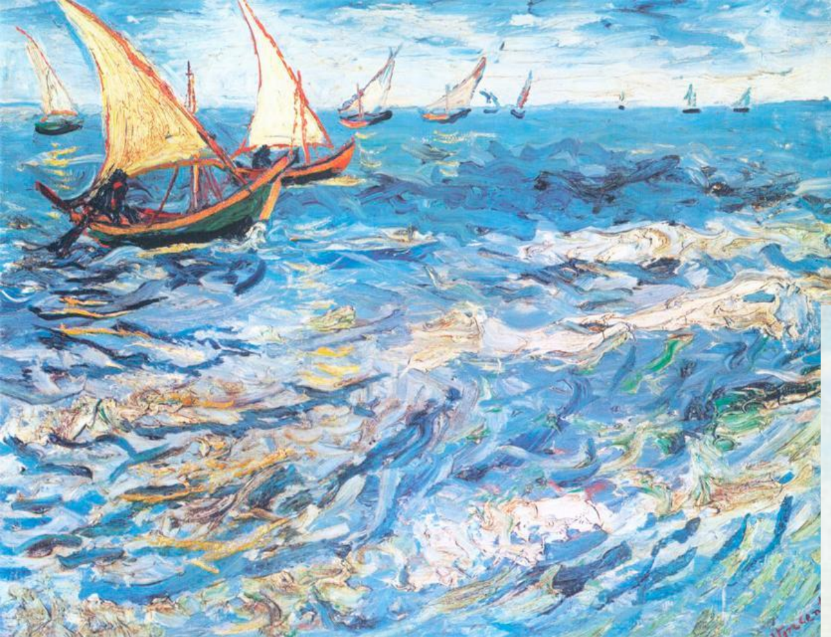
Винсент ван Гог «Море в Сен-Мари»

У каждого из них своя правда в передаче картины моря, шторма на море.