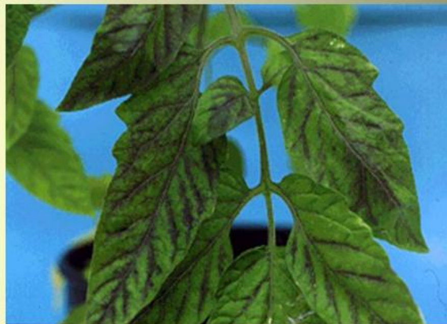
Признаки недостатка фосфора на листьях томата