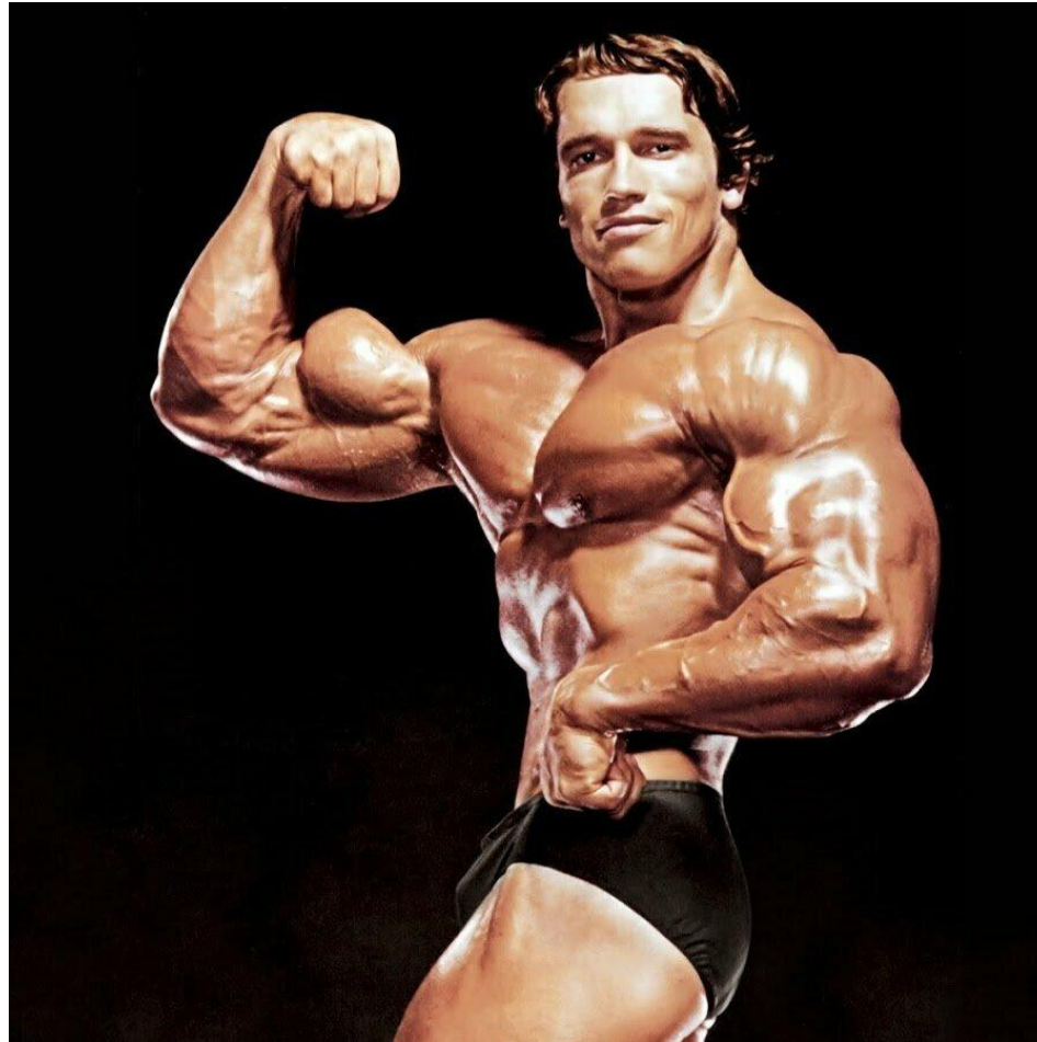
Арнольд Шварценеггер, бывший губернатор