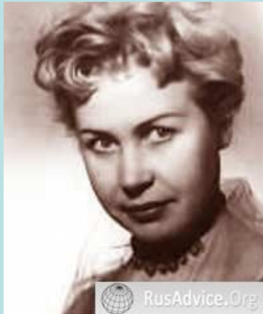
Инна Макарова — известная актриса. Родилась в г. Тайга.