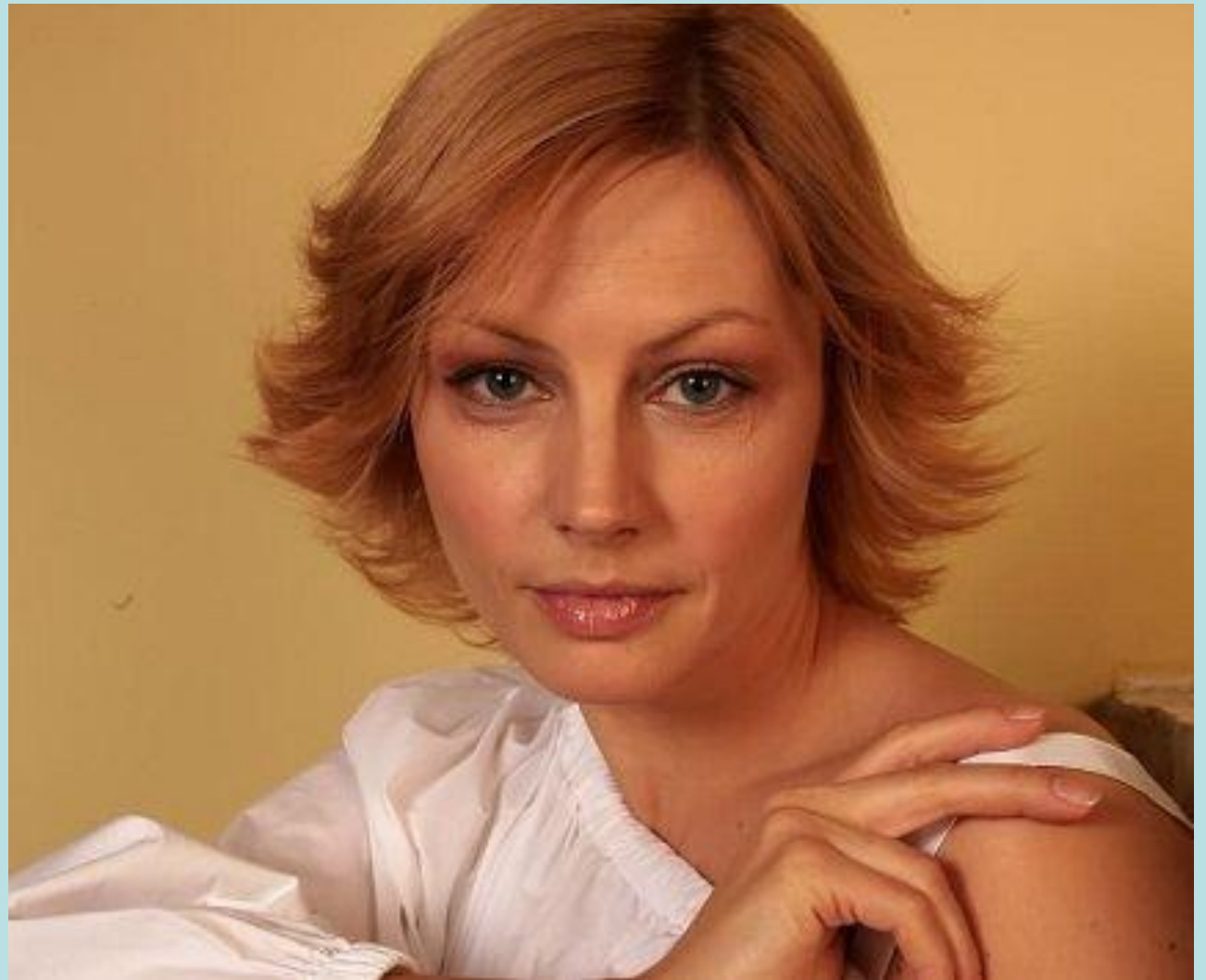
Алена Олеговна Бабенко — популярная актриса