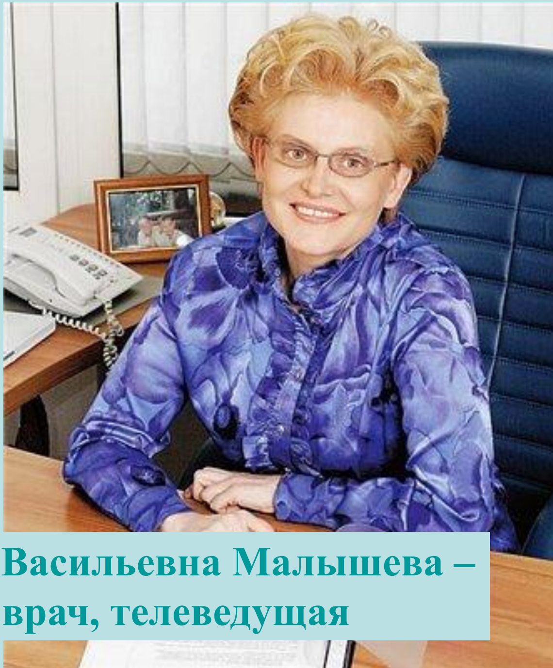
Елена Васильевна Малышева – врач, телеведущая