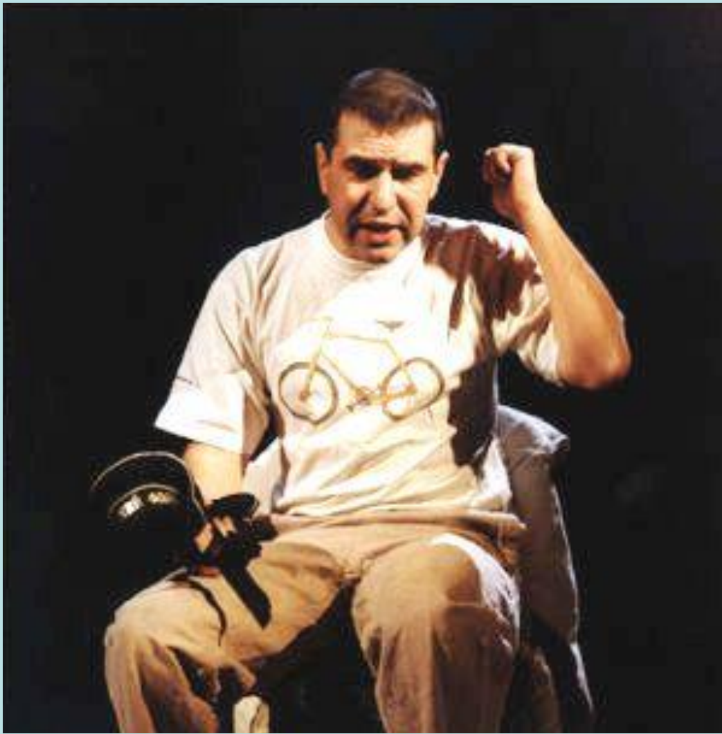
Евгений Валерьевич Гришковец драматург, актёр