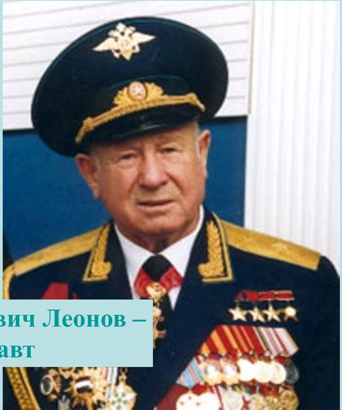
Алексей Архипович Леонов – КОСМОНАВТ