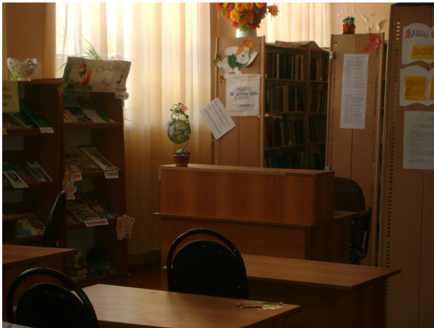
Козловская сельская библиотека