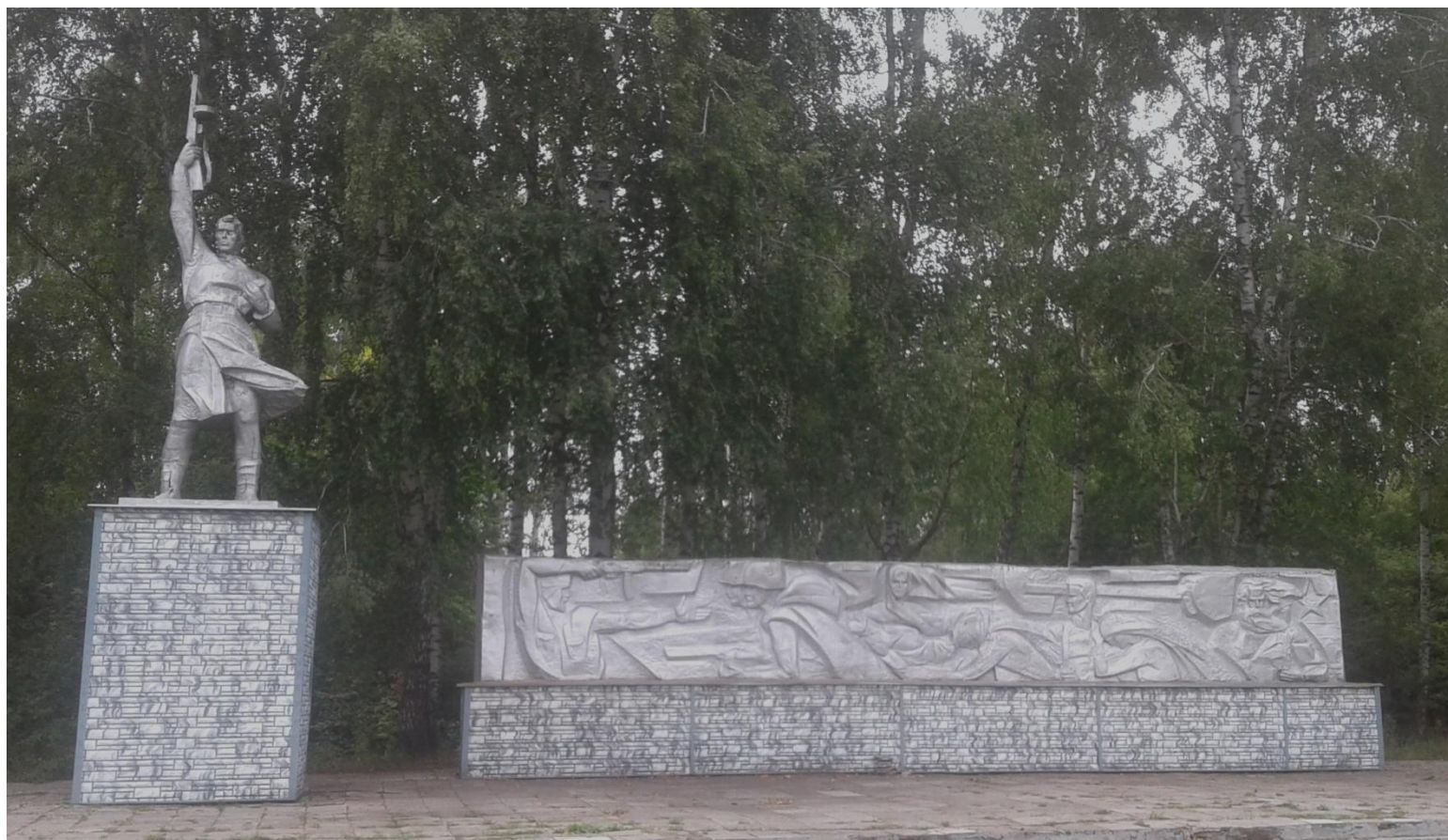
Памятник погибшим односельчанам после капитального ремонта в 2017 году