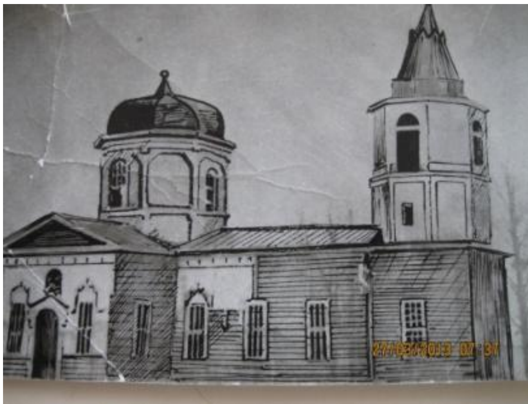
Деревянный храм во имя Николая Чудотворца