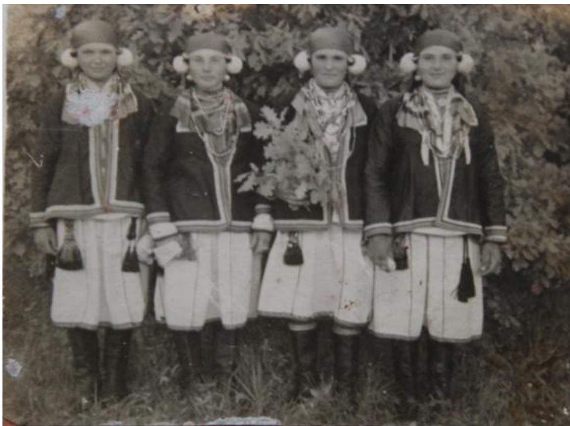
Национальная мордовская одежда