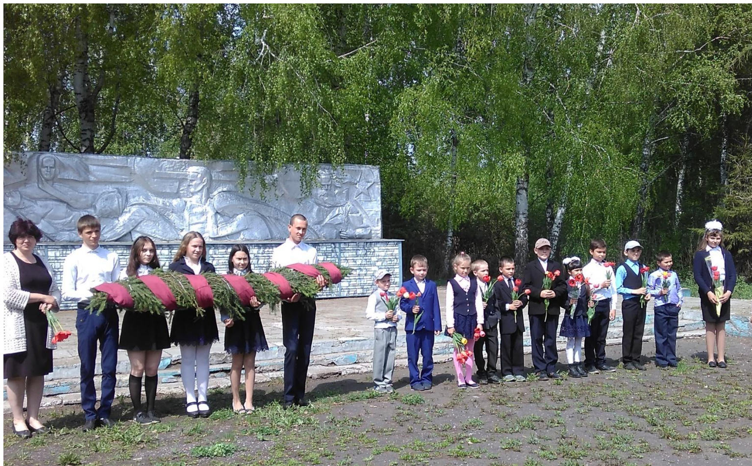
Митинг 9 Мая 2017 года