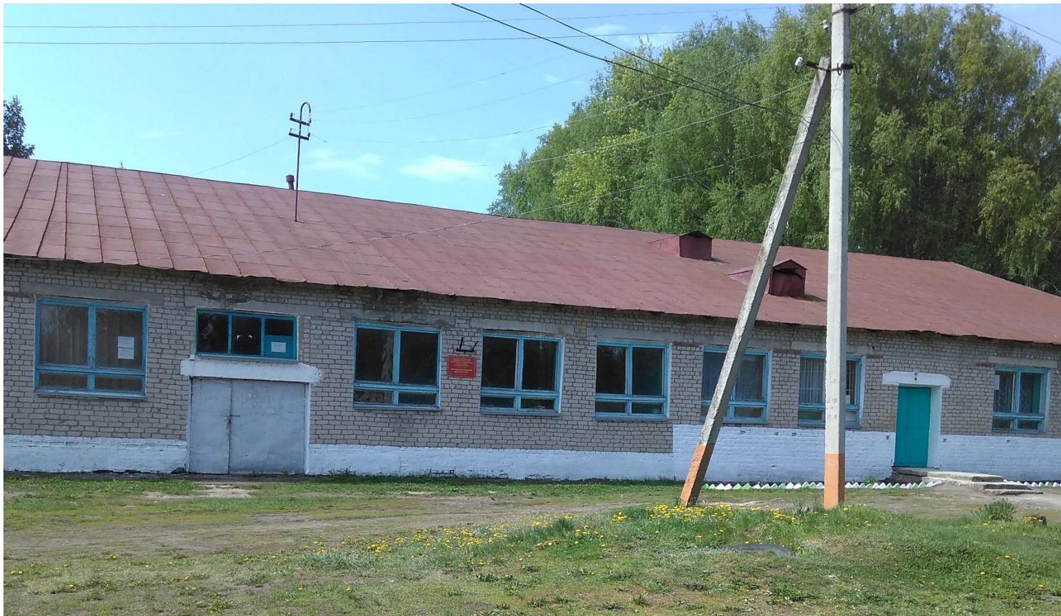
Козловский сельский дом культуры