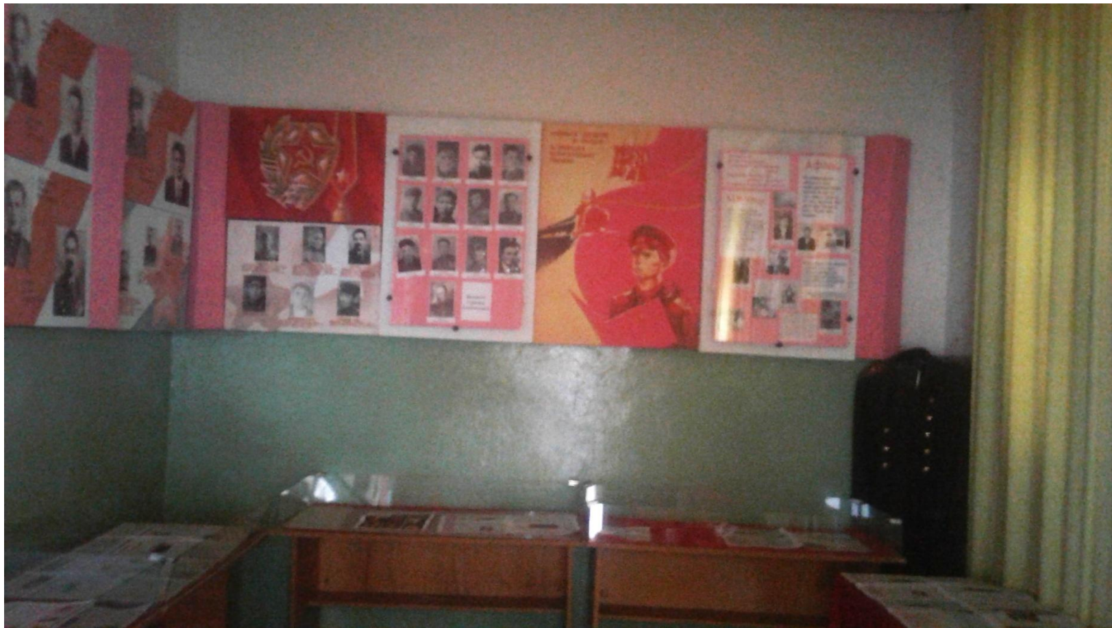
Комната боевой славы