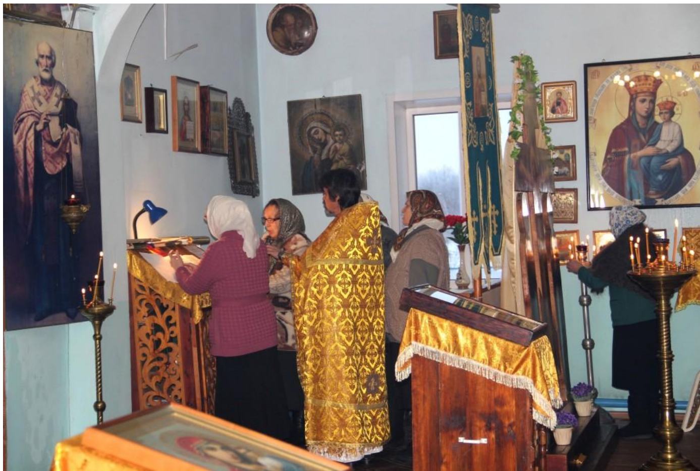
В церкви во время службы