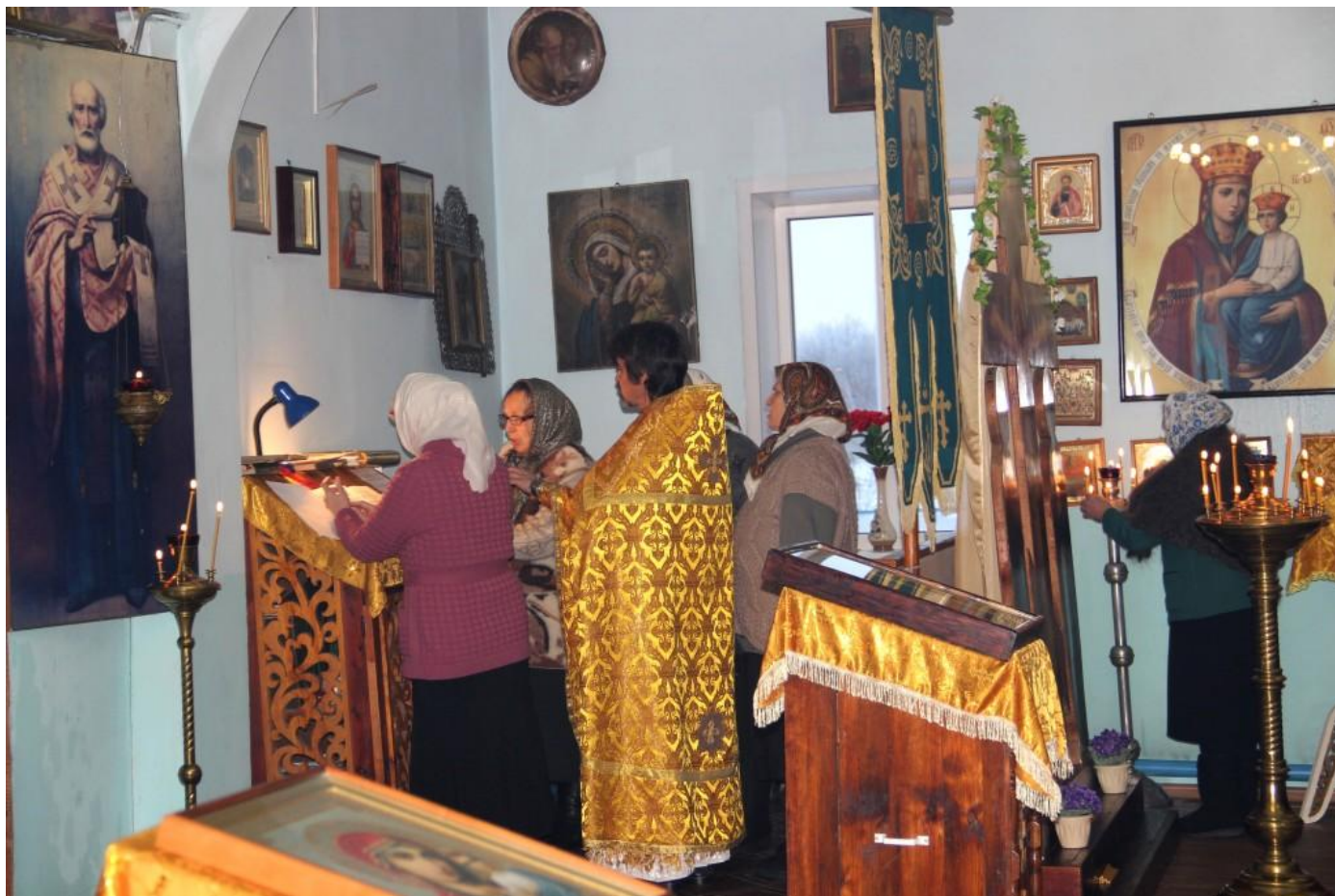
В церкви во время службы