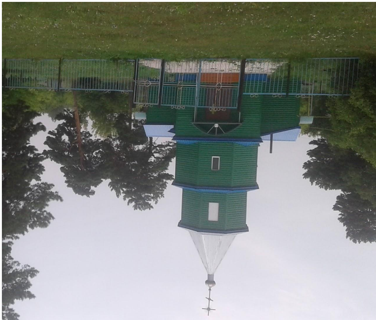
Заново отстроенный Храм