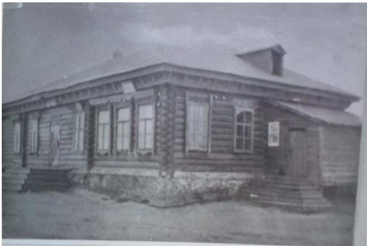
Школа в селе Пичёвка построена в 1931 году