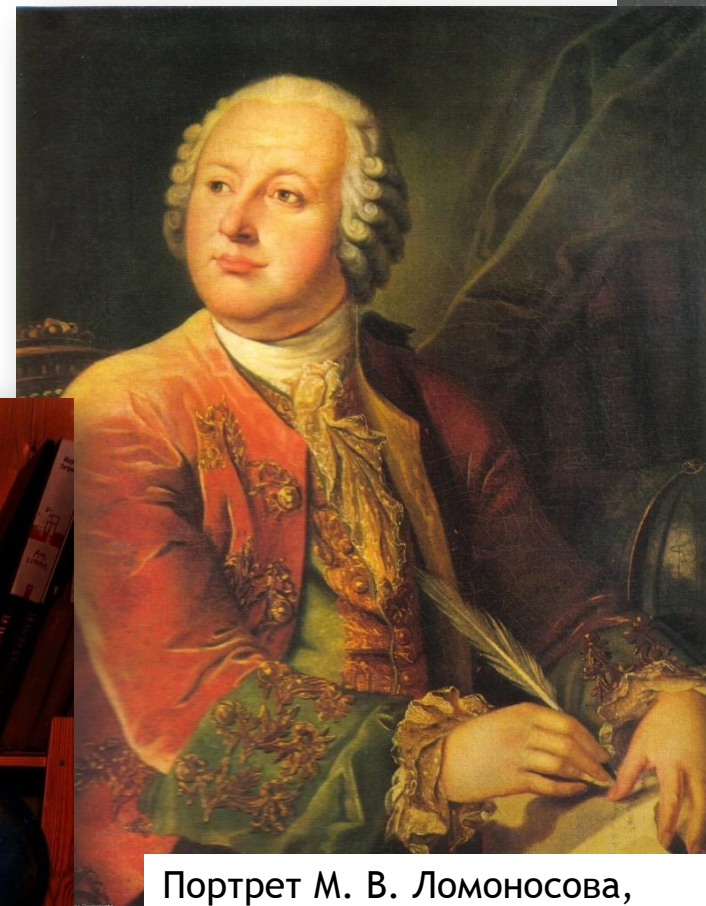
Портрет М. В. Ломоносова, Неизвестный художник XVIII века