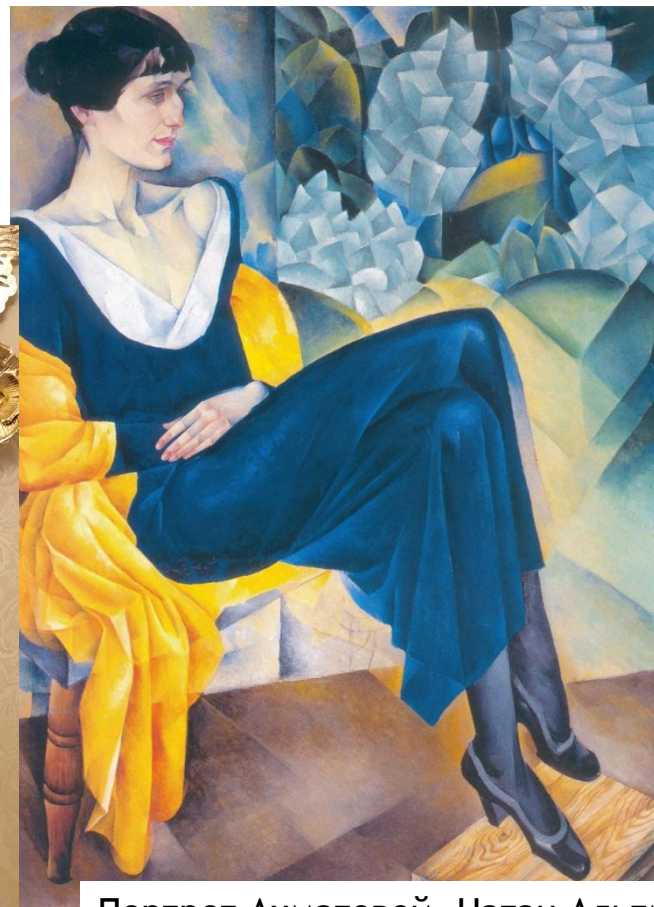
Портрет Ахматовой, Натан Альтман