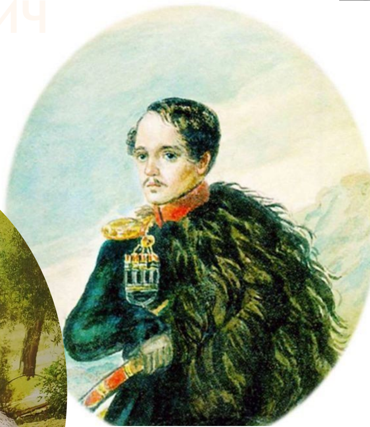
Михаил Лермонтов, автопортрет