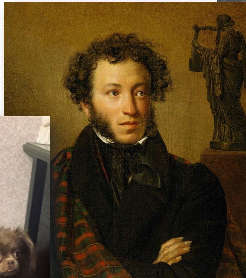
Портрет Пушкина, Орест Кипренский