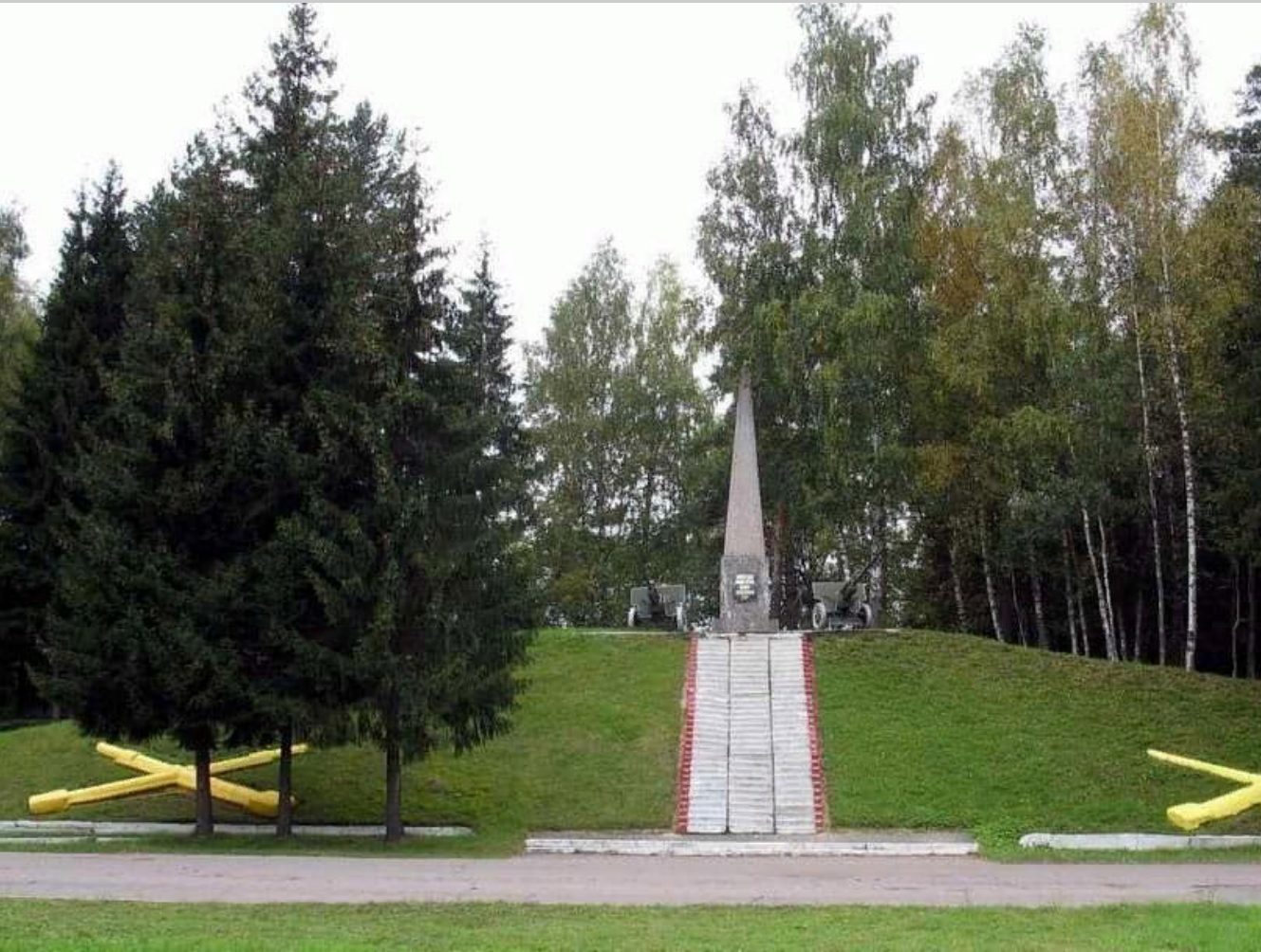
Мемориал - памятник артиллеристам в городе Луга.

В 1941 году этот маленький городок стал местом ожесточённых боев, разрушив планы захватчиков по быстрому захвату Ленинграда. Немцы практически за две недели прошедшие всю западную часть СССР, под Лугой были остановлены. Город держал героическую оборону в течение трех недель.