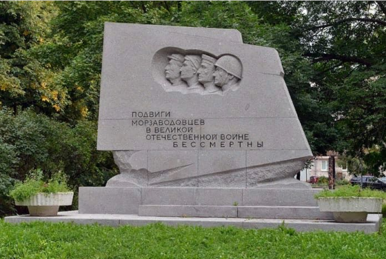
Памятник работникам Морзавода

К началу Великой Отечественной войны Кронштадт был крупной военно-морской базой, где располагалось много боевых кораблей и средств береговой и противовоздушной обороны. Город был огневым щитом Ленинграда. В самые тяжёлые месяцы блокады Кронштадт делился с жителями Ленинграда продуктами и обеспечивал поставку необходимых припасов в осаждённый город. За все время боевых действий немецко-фашистским войскам так и не удалось взять Кронштадт.