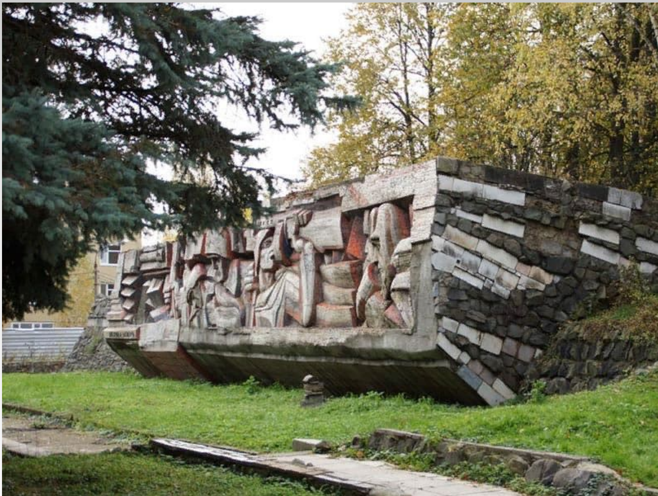
Мемориал павшим в боях за Родину в 1941 году.

Этот небольшой городок стал огромной преградой на пути немецких агрессоров к Москве. По плану "Тайфун" движение вражеских сил для нанесения главного удара по столице проходило через нарофоминские земли. В октябре 1941 года Наро-Фоминск подвергся серьезной бомбардировке и была захвачена часть города. Стойко и мужественно советские защитники удерживали противника на границе реки Нара. Два месяца длились кровопролитные бои, разрушившие большую часть сооружений и домов. Город не сдавался, держал оборону и 26 декабря войска 33-й армии под командованием генерала Ефремова полностью выбивают врага из Наро-Фоминска.