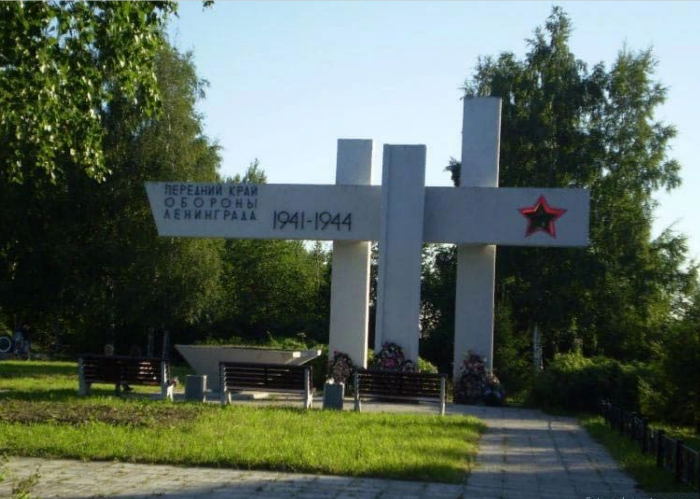
«Ижорский таран» - передний край обороны Ленинграда.

Город Колпино входил в систему обороны Ленинграда. Линия фронта в августе—сентябре 1941 года проходила в трёх километрах от города. Колпино постоянно обстреливали и бомбили. С первых дней Великой Отечественной войны рабочие колпинского завода начали формировать ополчение — Ижорский батальон. 15 сентября 1941 года немецко-фашистские соединения атаковали город и заняли несколько зданий на окраине, но ополченцы сумели выстоять при штурме и затем отбросить врага на исходные позиции.