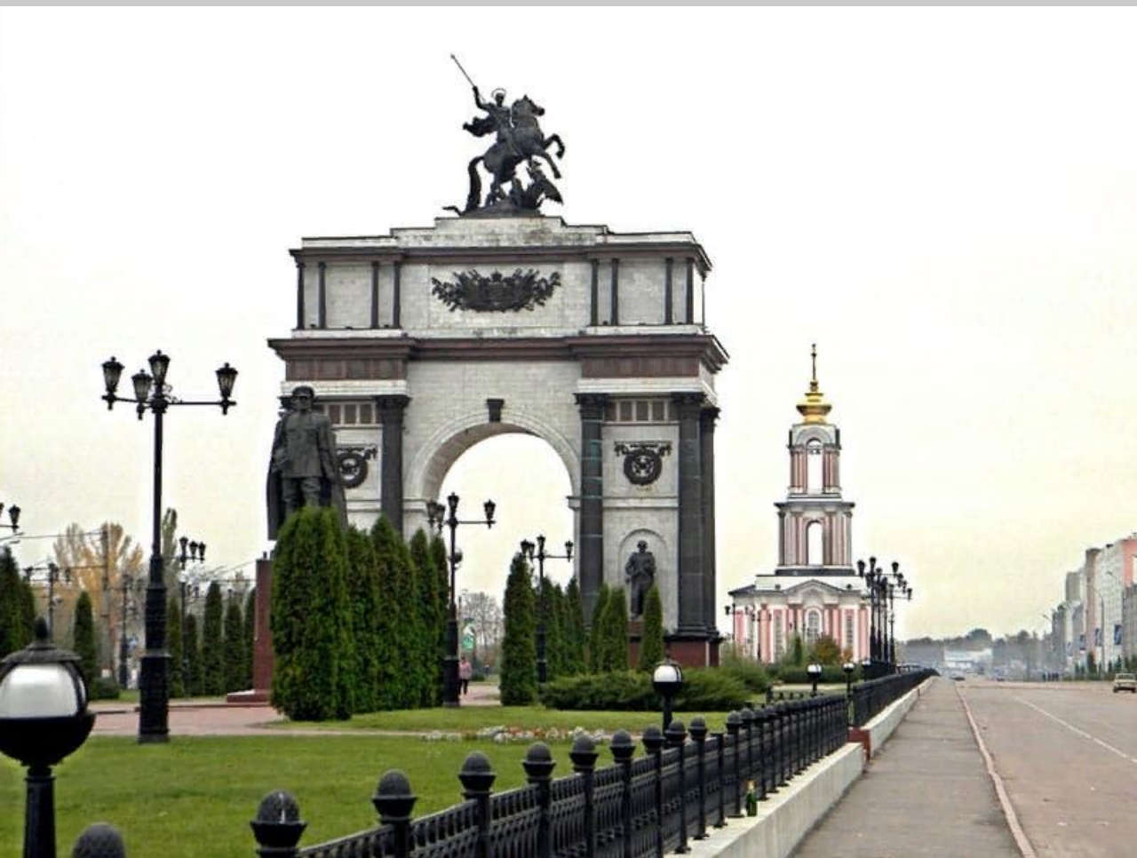
Мемориальный комплекс "Курская дуга" на въезде в город.

Первая бомбёжка Курска немецкой авиацией произошла уже 29 августа 1941 года, а в ночь на 3 ноября Курск был оккупирован. Во время боёв за город и при немецкой оккупации город сильно пострадал: материальный ущерб от разрушений составил более 742 млн рублей, не говоря о масштабных человеческих потерях.