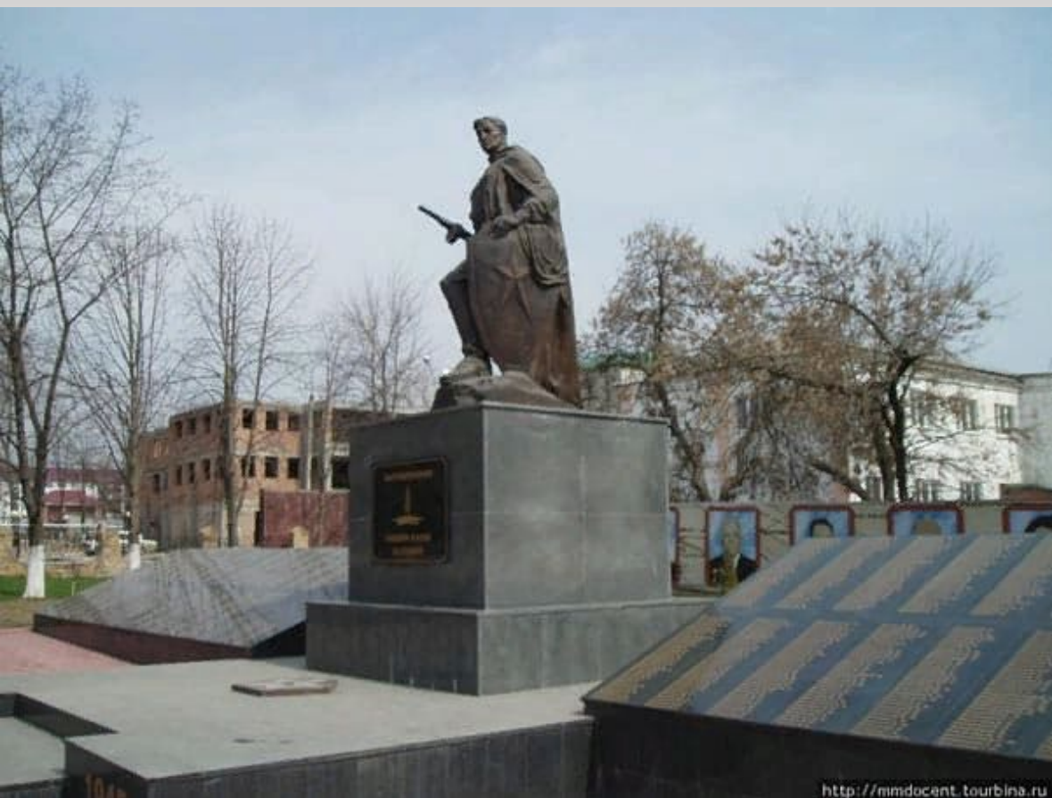
Памятник жителям города погибшим в годы войны.

Малгобек — один из богатейших центров нефтедобычи на Кавказе. Именно поэтому захват города был очень важен для немецкого командования.