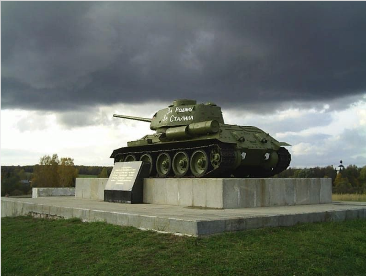
Памятник защитникам "Можайской линии обороны"

Затяжные бои на Можайском направлении были частью Московской стратегической оборонительной операции. Главной её целью было не допустить захвата гитлеровцами Москвы. Здесь велось сооружение Можайской линии обороны. К моменту вражеского наступления на Можайск линия обороны была готова менее чем на 50 %. С 12 по 18 октября 1941 года под Можайском шли упорные бои с фашистскими войсками, которые закончились прорывом обороны города. Зажатые с трёх сторон соединениями Советской Армией немцы 20 февраля 1942 года отступили от Можайска. Город был освобождён. На территории Можайского региона во время вражеской оккупации активно действовали партизанские отряды.