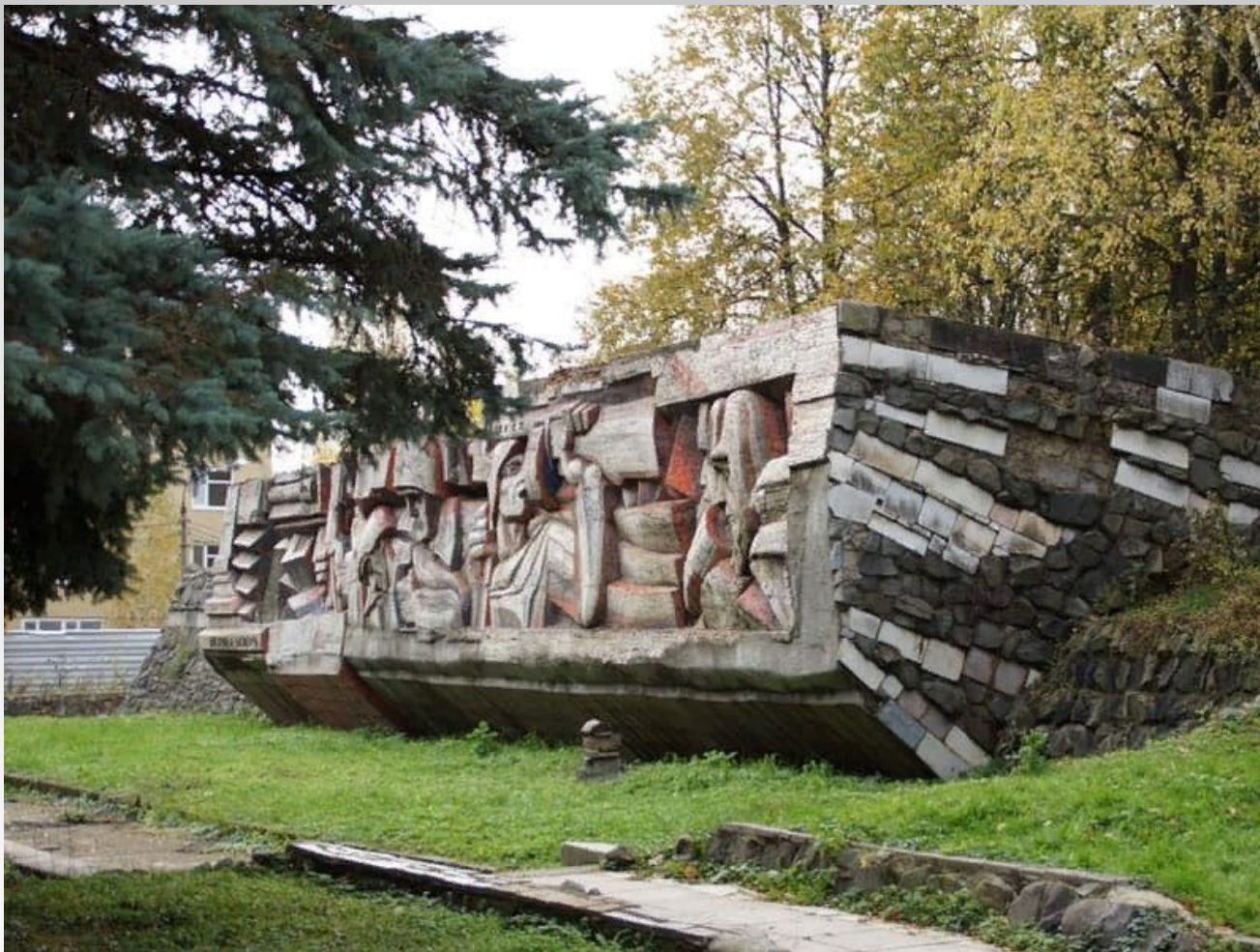
Мемориал павшим в боях за Родину в 1941 году.

Этот небольшой городок стал огромной преградой на пути немецких агрессоров к Москве. По плану "Тайфун" движение вражеских сил для нанесения главного удара по столице проходило через нарофоминские земли. В октябре 1941 года Наро-Фоминск подвергся серьезной бомбардировке и была захвачена часть города. Стойко и мужественно советские защитники удерживали противника на границе реки Нара. Два месяца длились кровопролитные бои, разрушившие большую часть сооружений и домов. Город не сдавался, держал оборону и 26 декабря войска 33-й армии под командованием генерала Ефремова полностью выбивают врага из Наро-Фоминска.