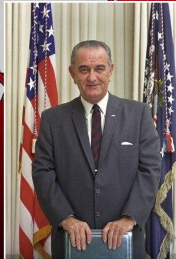
Линдон Джонсон 36-й президент США (1964—1968).

В соответствии с программой «борьбы с бедностью» были приняты: закон о помощи семьям с низким доходом, программа строительства дешевых жилищ, развития системы образования, медицинское страхование для престарелых граждан и др.