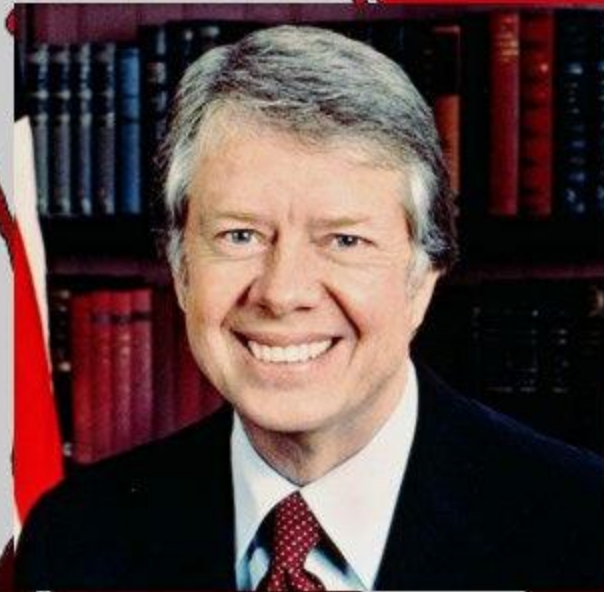
Джеймс Эрл Картер-младший 39-й президент США (1976—1980).

Эпизод с «кроликом-убийцей» только укрепил американцев во мнении, что Картер слишком слаб и чудаковат для своего поста.