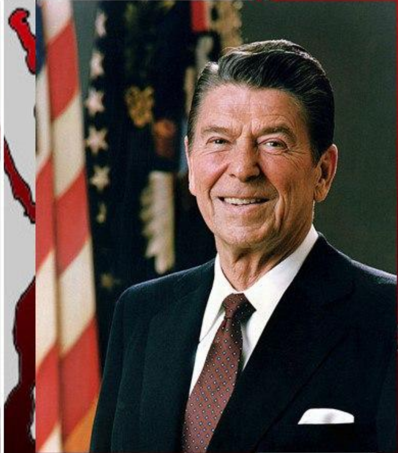
Рональд Рейган 40-й президент США (1980 — 1988).