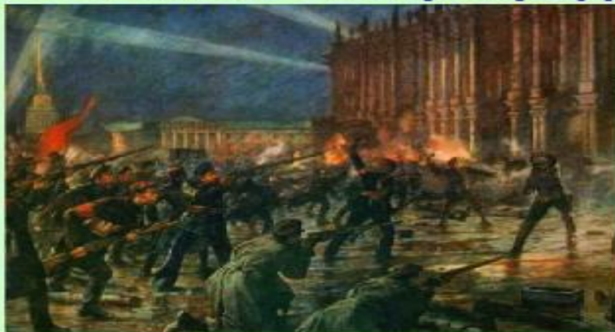
Штурм Зимнего дворца

Октябрьская революция была тщательно подготовлена большевиками. Все политические силы знали о планах большевиков, но действия власти были нерешительными и непоследовательными.