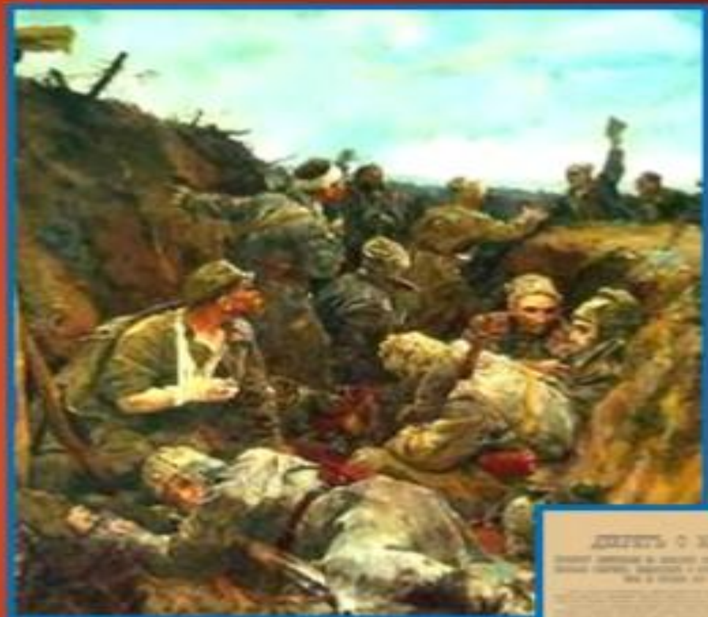
В. Серов. Декрет о мире.

Ленин сразу же предложил II съезду Советов принять Декреты о мире, о земле и о власти. Декрет о мире провозгласил выход России из войны. Съезд обратился ко всем воюющим правительствам и народам с предложением всеобщего демократического мира, т. е. мира без аннексий и контрибуций.