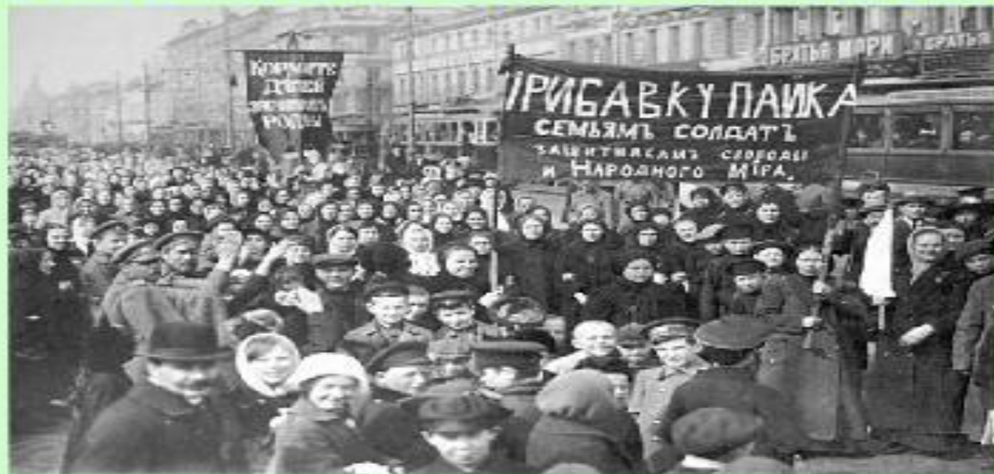
Демонстрация за прибавку пайка

Военные нужды поглощали 80% государственных расходов. Из-за недостатка топлива осенью 1917 г. закрылись более 800 предприятий. Выпуск промышленной продукции за год сократился на 36%. Железнодорожный транспорт не справлялся с перевозками. Города испытывали недостаток продовольствия. Хлебный паек в столицах сократился до 200 граммов. Росла инфляция, товары дорожали.