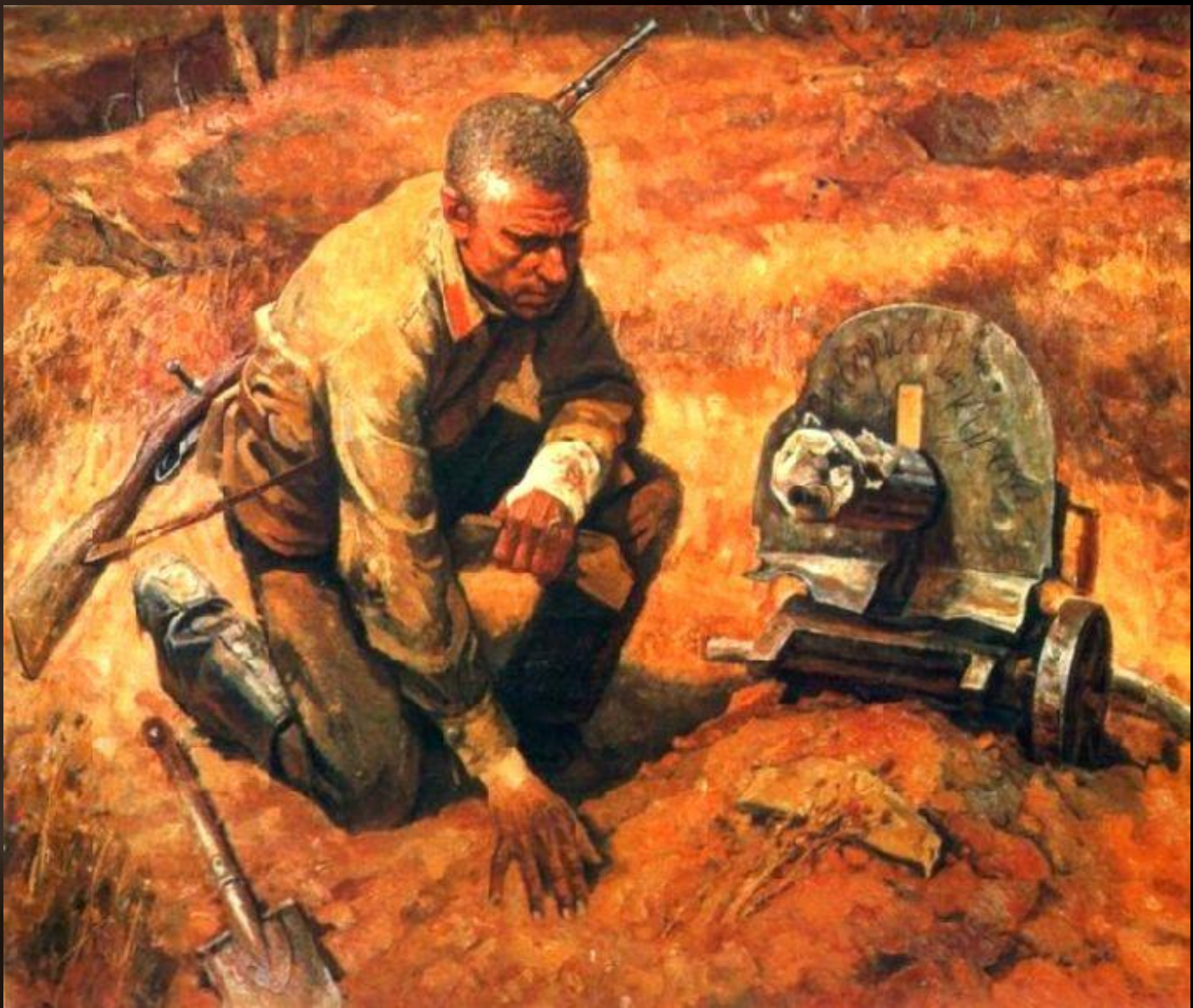
Б. Тарелкин «Товарищи» 1983