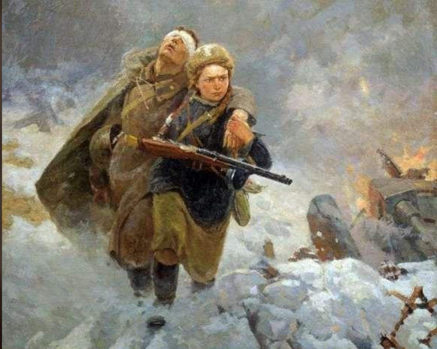
М. Самсонов « Сестрица » 1953 г.