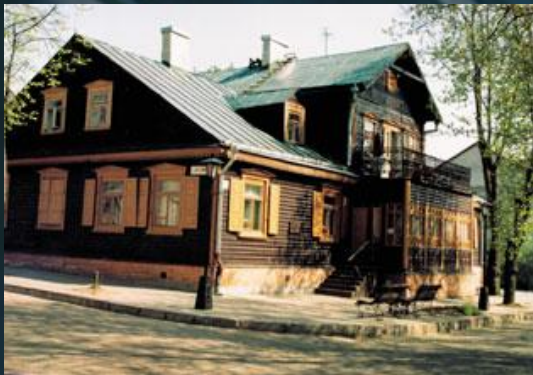
Дом-музей М. Багдановіча, г.Гродна

Вучобай хлопчыка займаўся тата, імкнучыся максімальна шырока і даступна падаць дзіцяці неабходныя веды. Сям'я пераехала з Гродна ў Порт, дзе кіраўнік сямейства атрымаў пасаду ў банку. Там малады чалавек паступіў на навучанне ў Ніжагародскую мужчынскую гімназію. Будучы знакаміты паэт выхоўваўся ў творчай атмасферы: у доме яго бацькоў часта бывалі прадстаўнікі інтэлігенцыі, тут вяліся дыскусіі на грамадска-палітычныя, культурныя тэмы. У той час у модзе былі рэвалюцыйныя руху, адгалоскі якіх пасля адаб'юцця ў паэзіі аўтара. Неўзабаве сям'ю напаткала цяжкая страта: ад сухотаў памерла маці будучага паэта. Па характары маленькі Максім Багдановіч быў падобны менавіта на яе: ён быў таксама вясёлы, жыццярадасны, непасрэдавен, вельмі ўражлівы. У 1896 годзе бацька сямейства прыняў рашэнне пераехаць у Ніжні Ноўгарад.