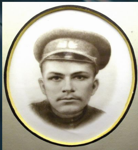
Максім Багдановіч у час вучобы ў гімназіі, Ніжні Ноўгарад (1902-1908)