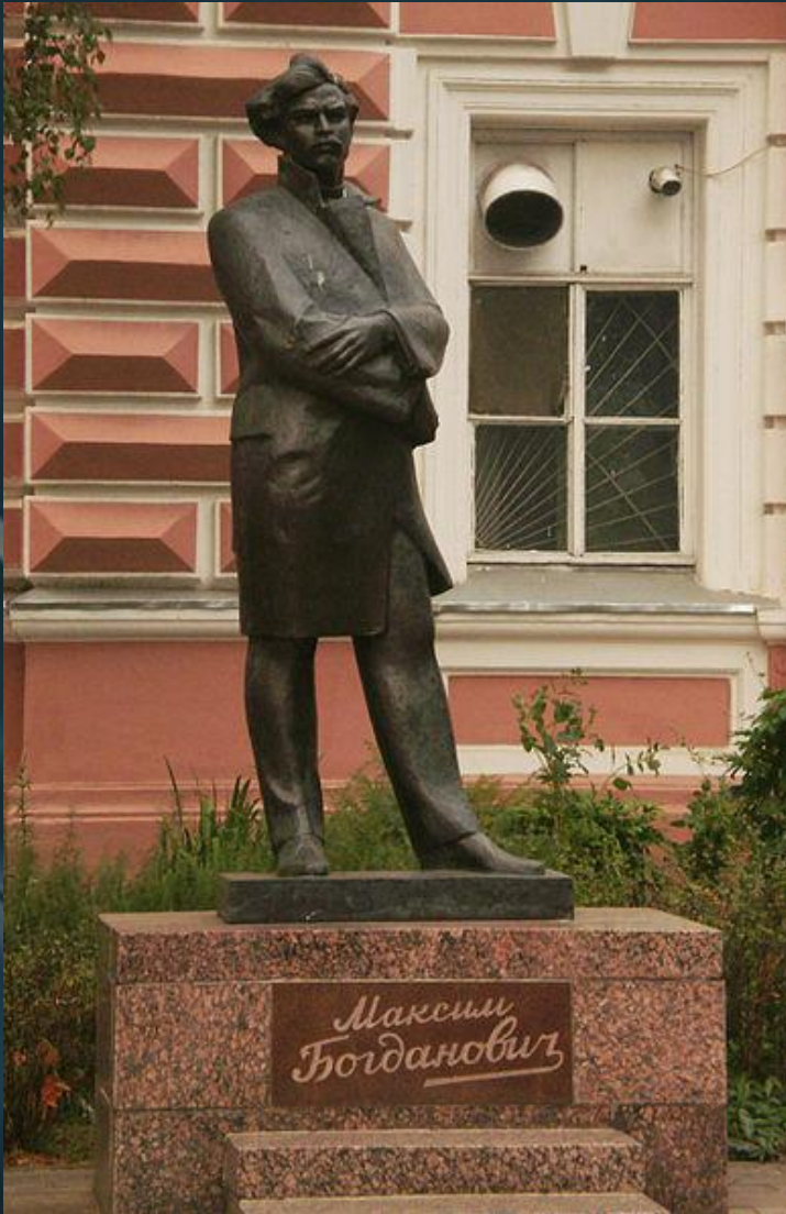
Помнік у Яраслаўлі