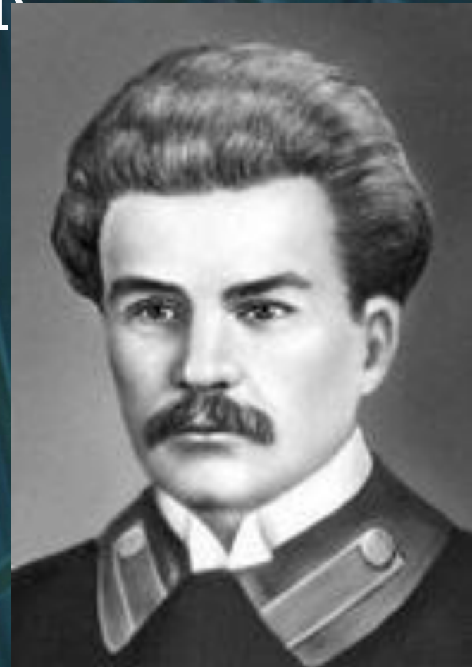
Пад час вучобы ў ліцэі