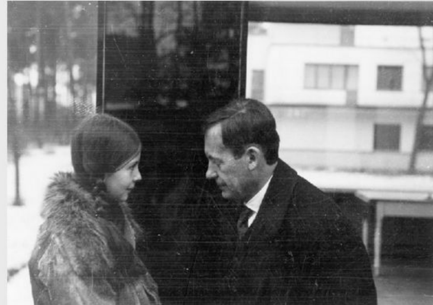
Вальтер Гропиус с дочерью Манон, 1927