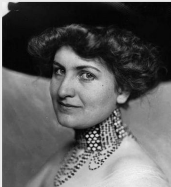
Портрет Альмы Малер, 1909