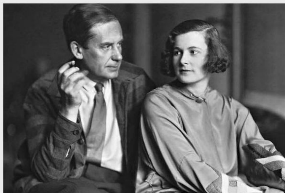
Вальтер и Иза Гропиус, 1923