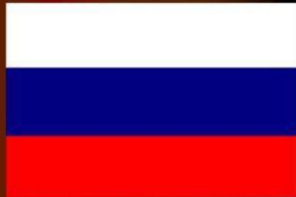
Флаг при Петре I