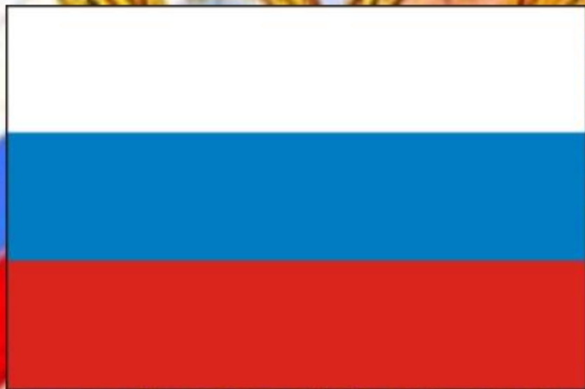
Флаг Российской Федерации