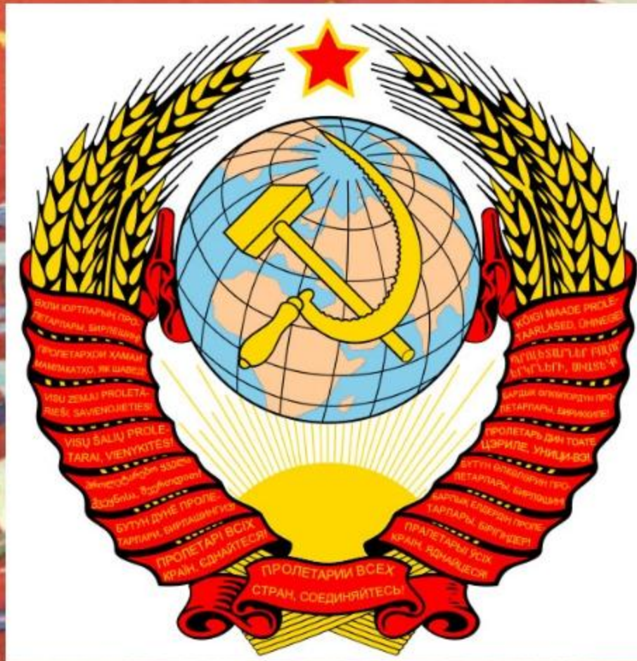
Герб СССР 1956 по 1991 года