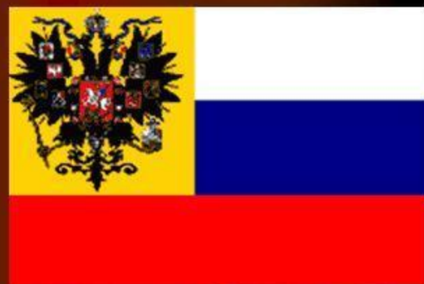
Флаг при Александре III 1883 г.

Первое изображение флага Дмитрия Донского