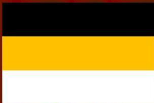
Флаг при Александре II. 1858 г.