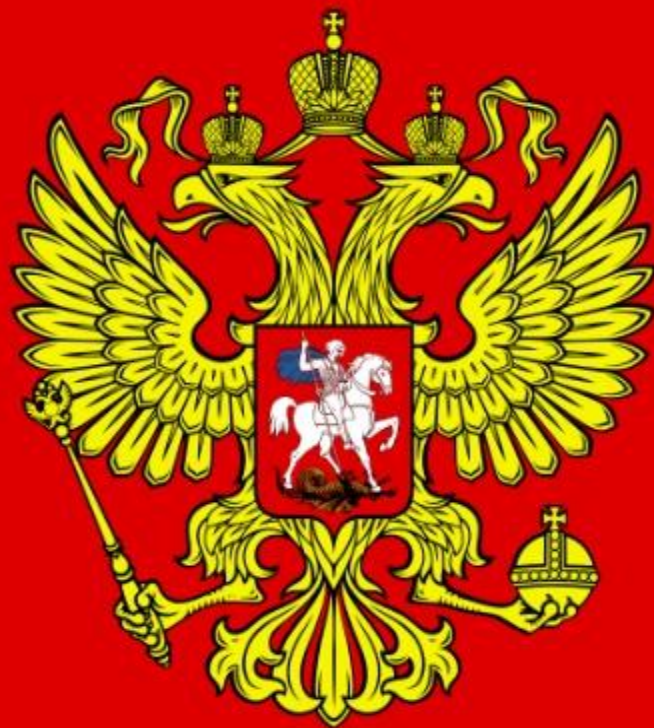
Герб Российской Федерации

В 2000 году был принят новый закон «О Государственном Гербе Российской Федерации», устанавливающий описание и порядок использования герба.