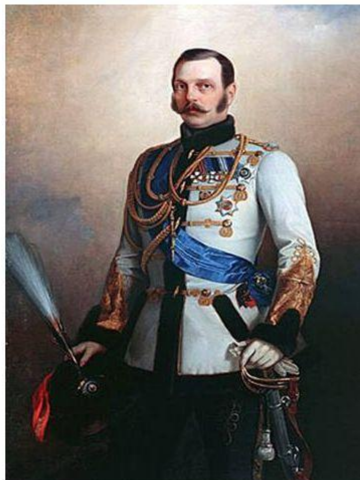
Император Александр II.

Император Александр II 11 июня 1858 года утвердил новый российский государственный флаг — черно-желто-белый.