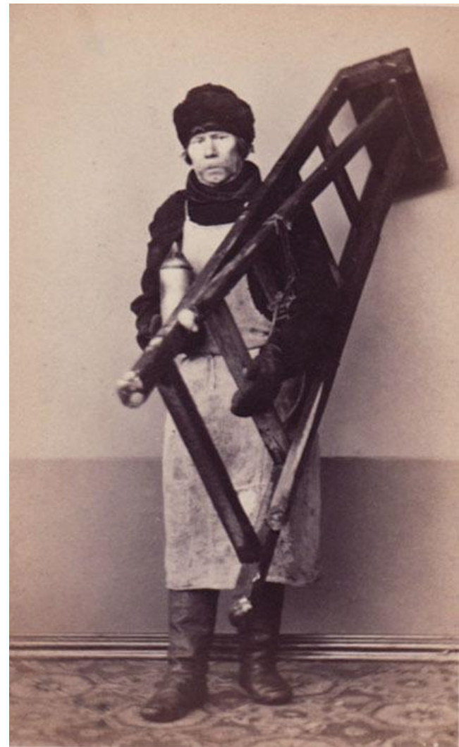
Фонарщик. 1860-е годы