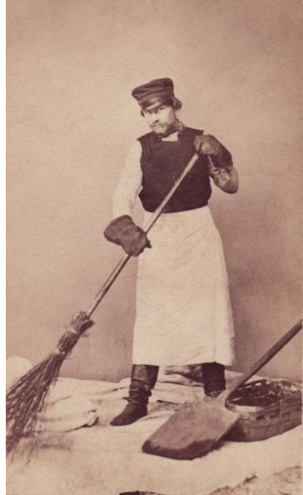
Дворник. Санкт-Петербург, 1860-е годы