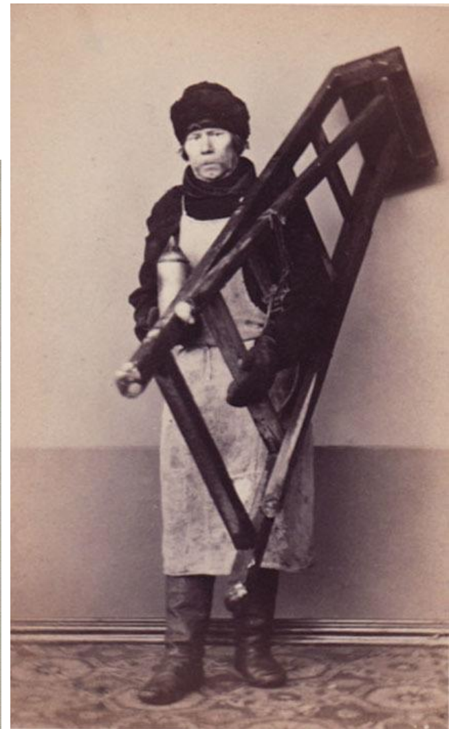
Фонарщик. 1860-е годы