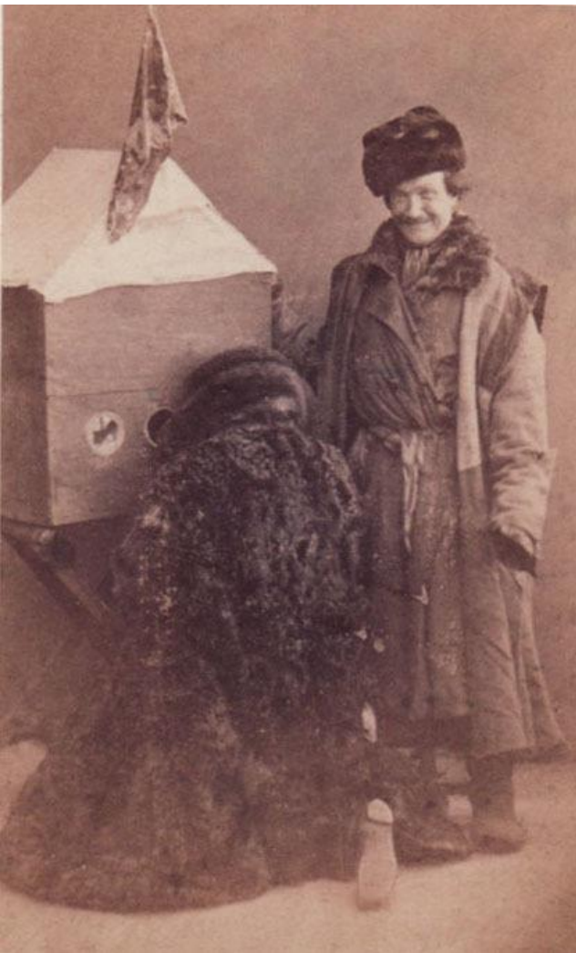
Раешник. Фотография ателье Laurent. 1860-е годы