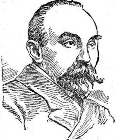
Карл Маркс и Фридрих Энгельс