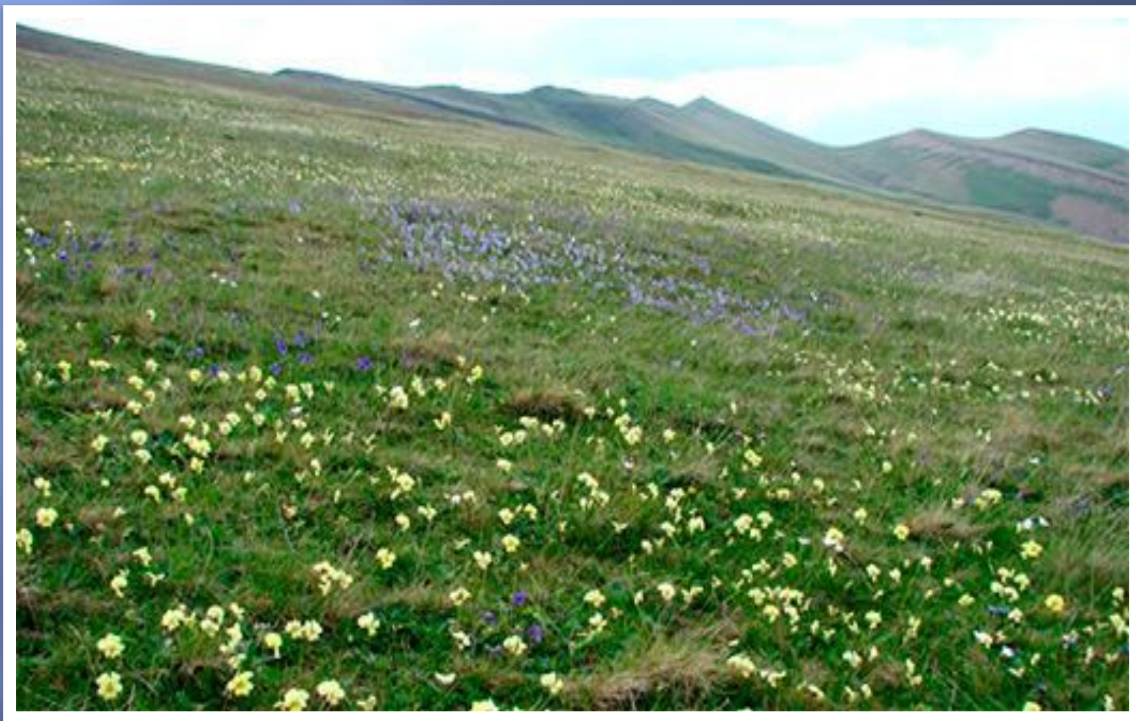
Субальпийские луга нагорного Дагестана