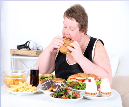
Повышенный аппетит и изменение массы тела