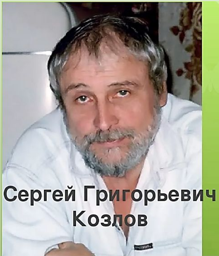
Сергей Григорьевич Козлов

Свои первые стихи Сергей Георгиевич начал писать в восьмом классе. Окончил литературный институт. А с двадцати лет начал писать сказки, тогда же придумал Медвежонка, Зайца и Ёжика. Истории о них сочиняет до сих пор.