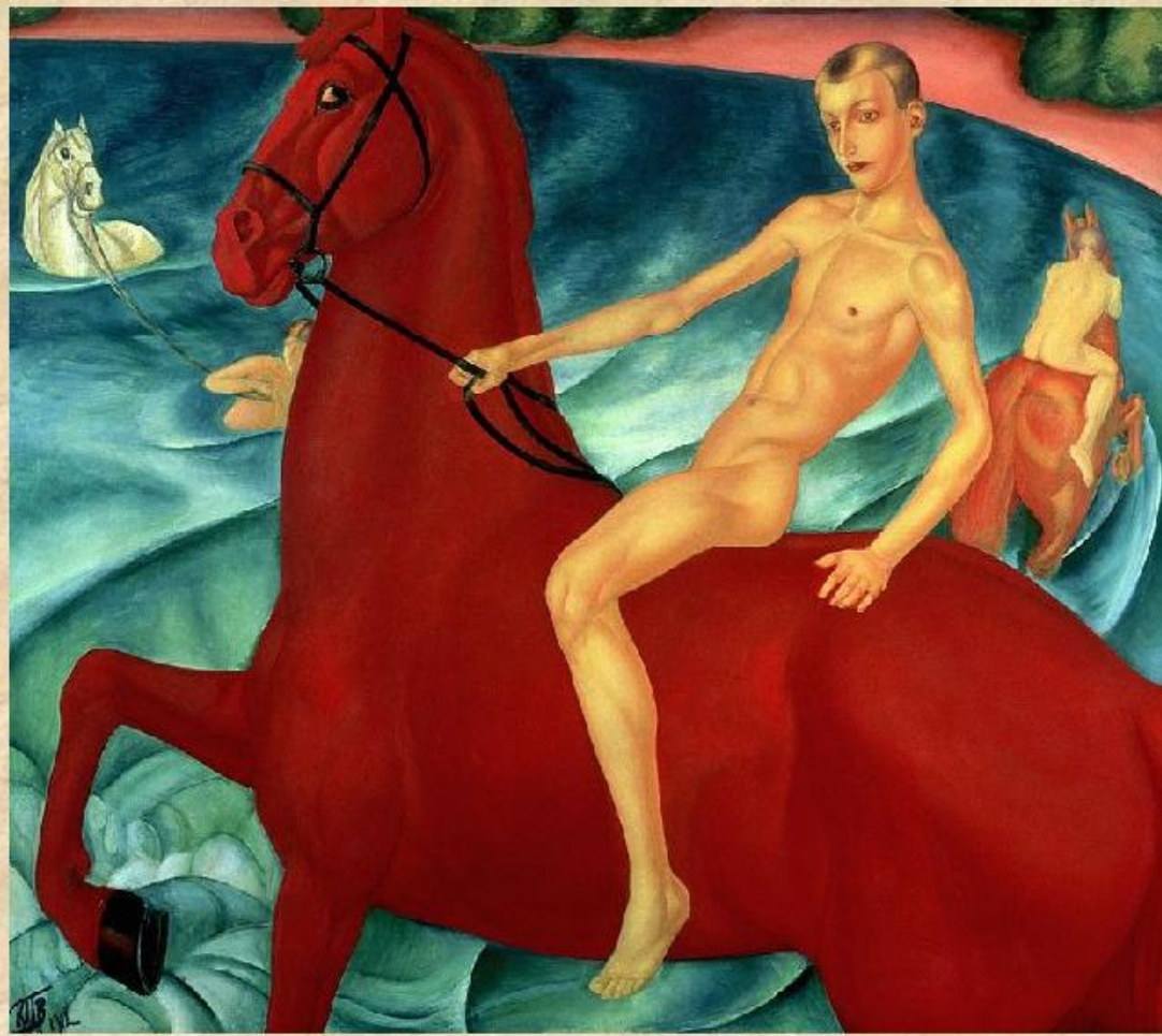
КУЗЬМА ПЕТРОВ-ВОДКИН «Купание красного коня»