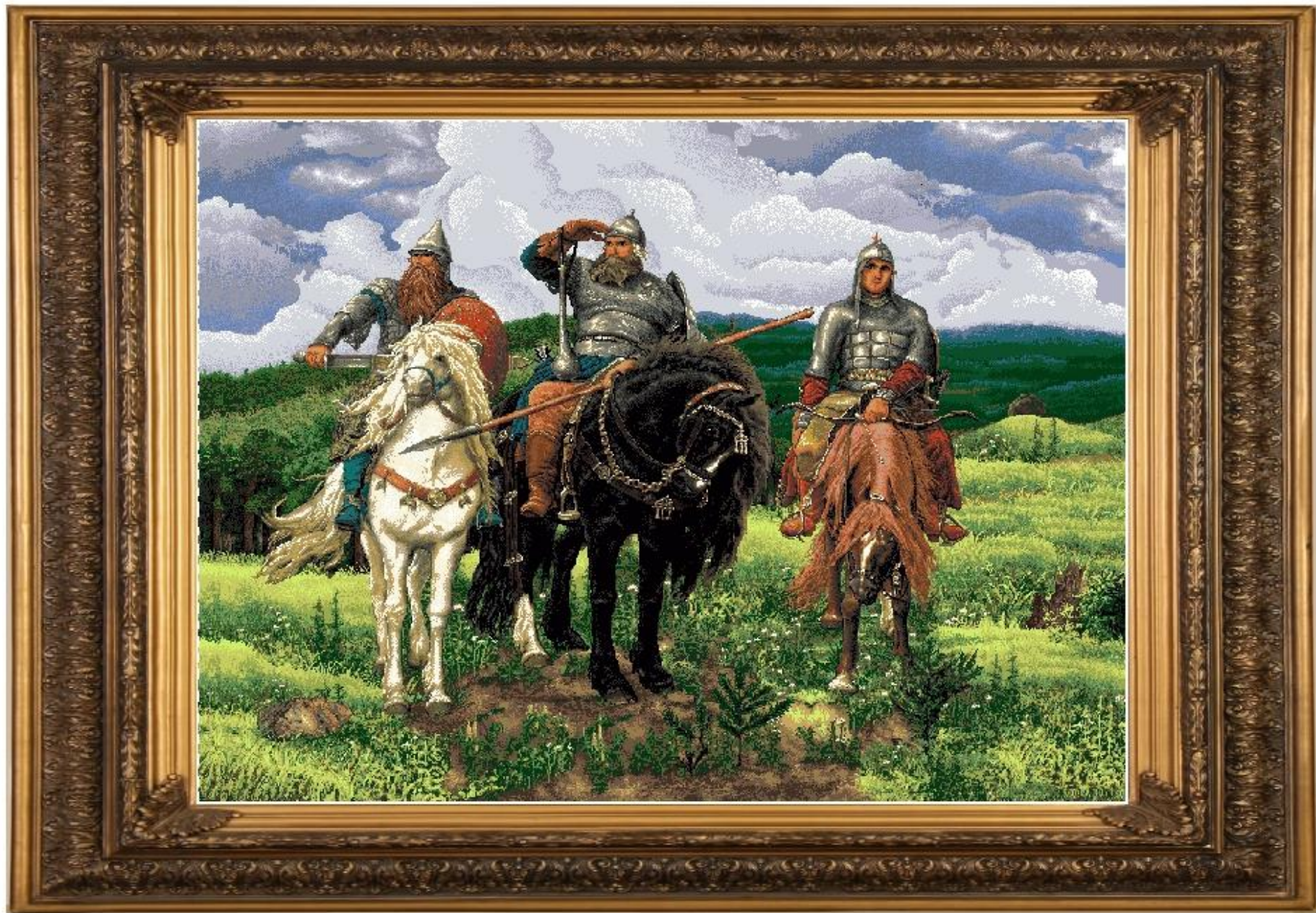
В. Васнецов. Богатыри