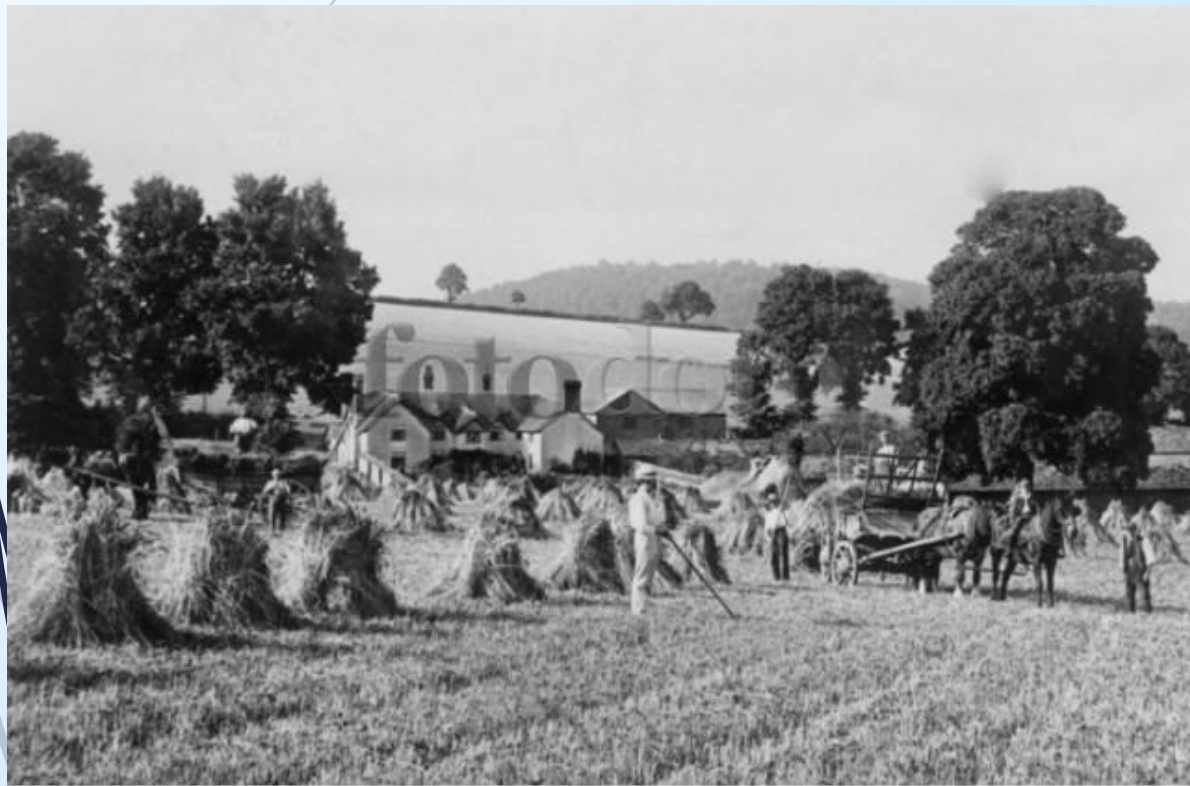
www.fotodom.ru T013-2774 TopFoto Сельская жизнь в Англии начала 20-го века. На фото: работа в поле.

Жителям Веселого Села було дійсно весело, оскільки вони не знали ні широти, ні довготи, ні, на щастя, навіть держави, куди приїхали. Поселенці, наприклад, не мали поняття про те, коли потрібно удобрювати землю, і, без жодної задньої думки, удобрювали її постійно.