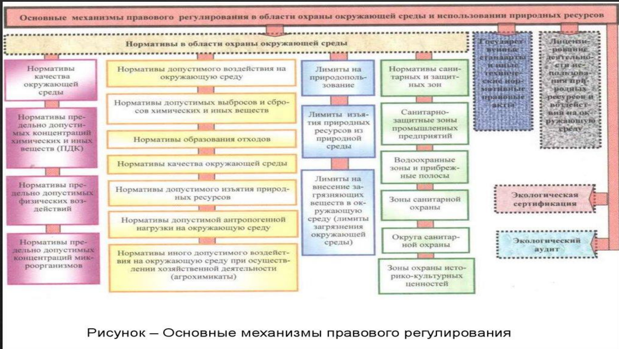
Рисунок – Основные механизмы правового регулирования