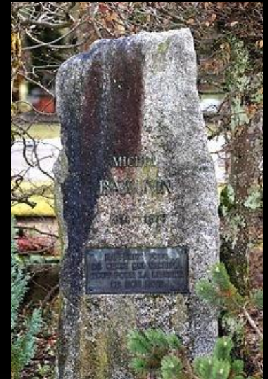
Могила Бакунина в Берне

Умер Михаил Александрович Бакунин 1 июля (19 июня) 1876 года в Берне, в Швейцарии, в больнице для чернорабочих, куда он был помещён по его настоянию.