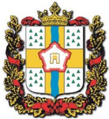
МИНИСТЕРСТВО ПО ДЕЛАМ МОЛОДЕЖИ, ФИЗИЧЕСКОЙ КУЛЬТУРЫ И СПОРТА ОМСКОЙ ОБЛАСТИ